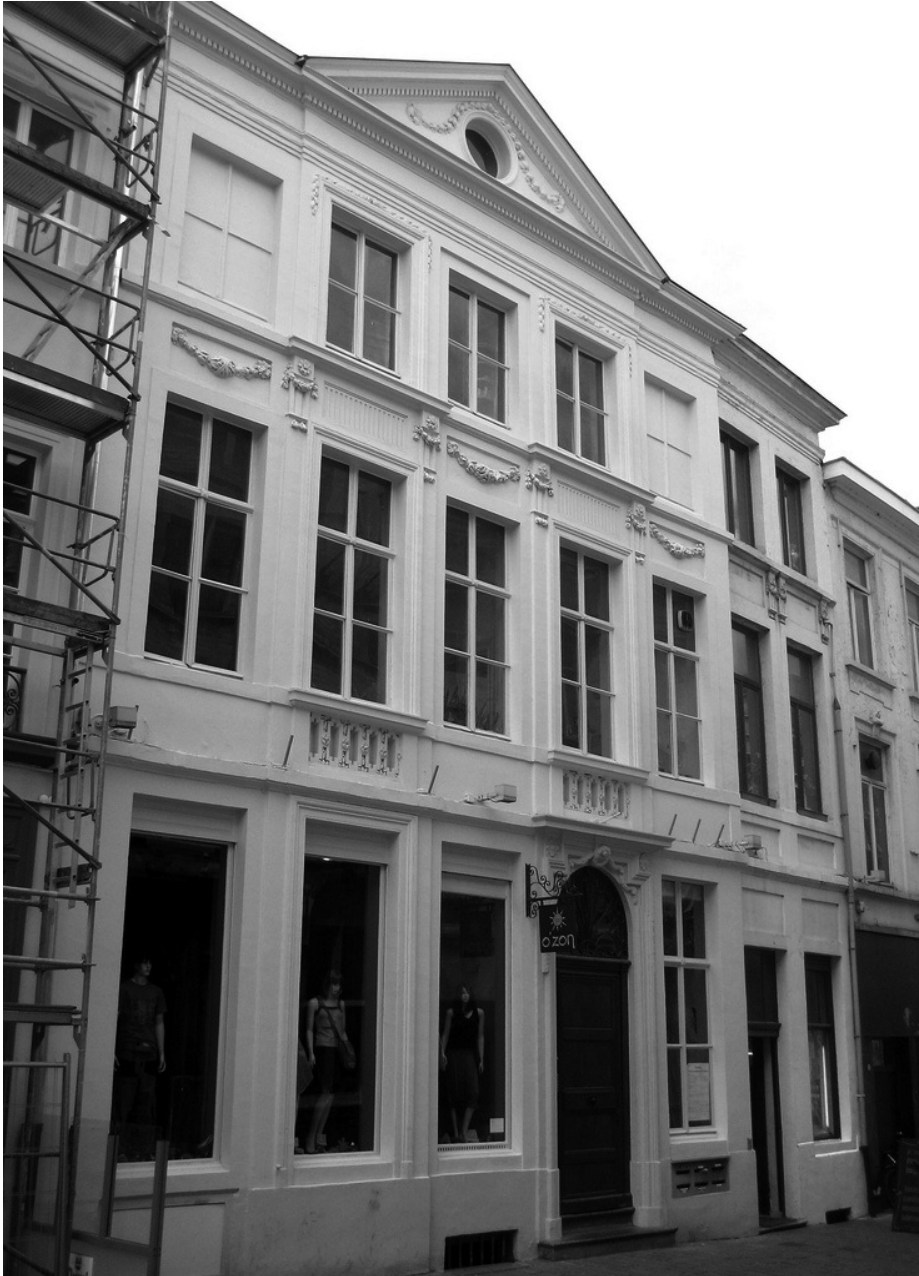
Hoogpoort 24-26 - anno 2010.