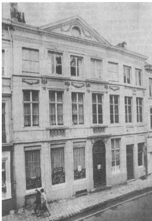
Hoogpoort 24-26, herenhuis uit 1776.

Er bestaat een klein historisch overzicht of vademecum voor de toerist die in het Sint-Jorishof op de hoek van de Hoogpoort en de Botermarkt afstapt, een soort curriculum vitae, dat men bij de thuiskomst uit zijn reiskoffer haalt en zijn vrienden en kennissen opdist; wij hebben het in alle foldertjes de jongste jaren door het Sint-Jorishof uitgegeven, teruggevonden. Het bevat zelfs wat meer dan de gewone Gentenaar er van afweet of zou moeten afweten: 'Het Sint-Jorishof te Gent dagtekent van 1228. Het is met de hoofdkerk van St.-Bavo, het Gravenkasteel, de St.-Niklaaskerk en het Belfort een der oudste gebouwen van Gent. Vanaf het begin was het een gasthof, beroemd door gans Noord-Europa voor keurige bediening, fijne wijnen en likeu-