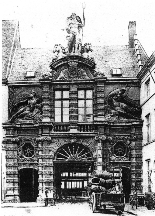
Sint-Veerplein: ingang van de oude vismarkt en vismijn.