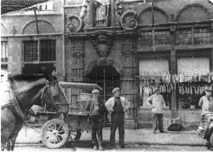
Mijn grootvader (midden rechts). In het interbellum reed hij iedere week met paard en kar naar de vismijn.