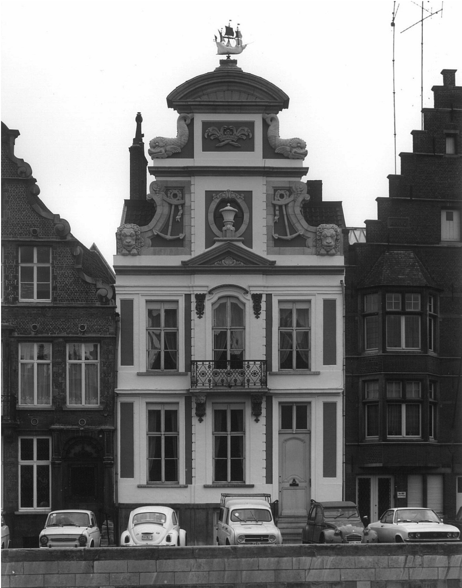
Het Gildehuis der Onvrije Schippers op de Korenlei

Zie “Ghendtsche Tydinghen” 2002 - N° 6 - p. 362-363.