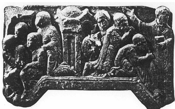
St.-Bavo's grafkapel in het Steenmuseum te Gent - 1