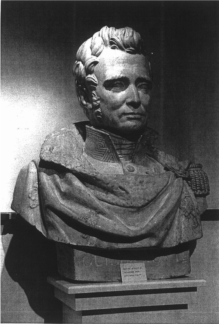
Naar dit borstbeeld van Thil. Parmentier (1828) wordt het monument van 2015 ontworpen.