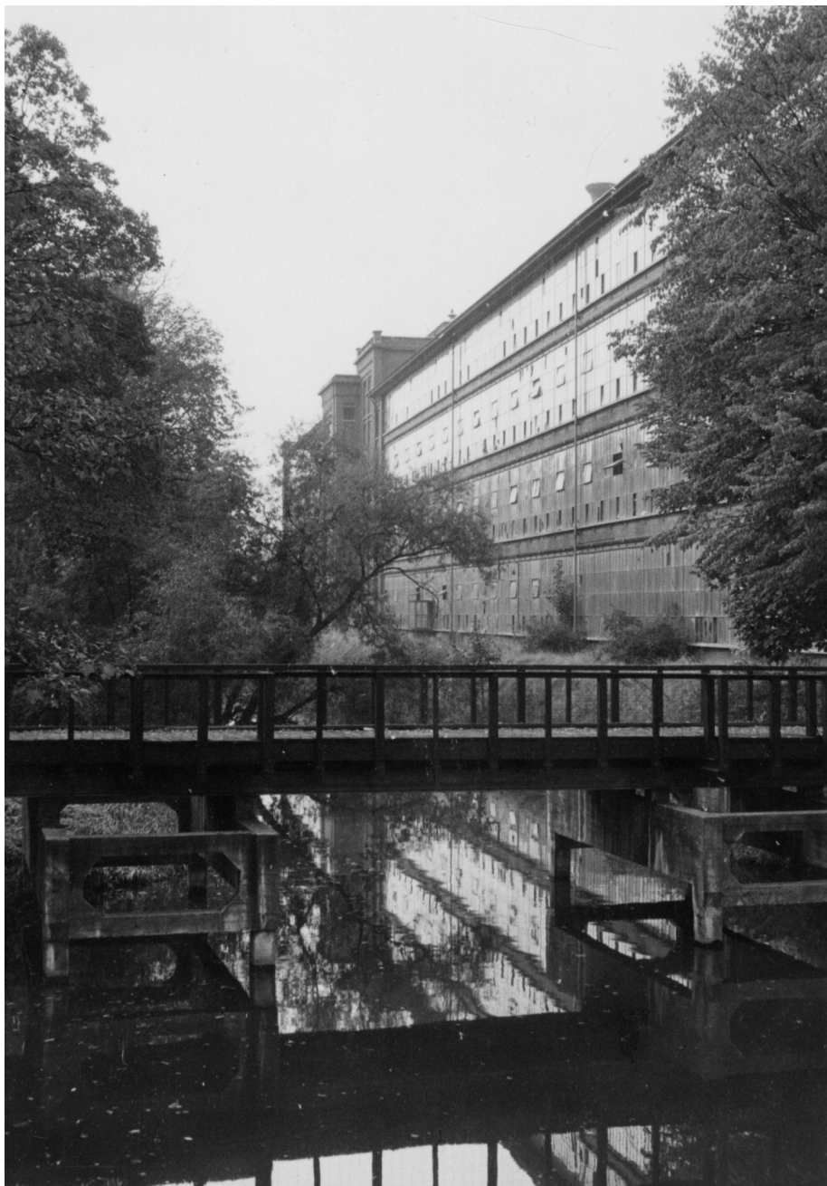
De "Lys" - foto genomen op 20 Oktober 1964.