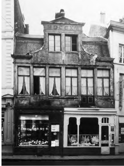
Afb. 1. Foto uit 1956 (SCMS 2545, historische verzameling van de Stedelijke Commissie voor Monumenten en Stedenschoon bewaard in het Gentse Stadsarchief.

modern ensemble geïsoleerde gevels, of zolang het bij een zogeheten modernisering of aanpassing van een uitstalraam blijft, reageren de mensen niet en ze zijn zelfs onverschillig. Maar de dag dat er een steen van de kathedraal of het Belfort zijn eeuwenoude plaats ontglipt en op het voetpad neerploft, wordt het een gejack en gesakker over de nalatigheid, het in gebreke blijven, de gierigheid, de slechte werking van de technische diensten en noem maar tot morgen vroeg op... De overheden hadden het moeten voorzien, hadden sedert lang het gebouw moeten herstellen, de nodige kredieten uitschrijven. Geen mens in de straat die niet weet hoe men had moeten handelen om dergelijke "moordachtige" feiten te vermijden.