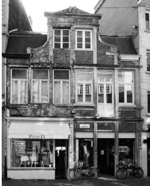
Afb. 3. Actuele toestand (mei 2014).

of verdeling, naar twee of meer eigenaars overgingen. Nooit was het echter voorgevallen dat op die manier gehandeld werd. De plannen en voorstellen zoals zij ingediend werden, moesten categoriek van de hand gewezen worden, temeer daar de huizen (in die tijd nr. 10 en 12) een zeer typisch voorbeeld uitmaken van de Gentse architectuur uit het eerste kwart van de achttiende eeuw. De eigenaar deed een nieuwe poging maar ving opnieuw bot. De stedelijke commissie wees andermaal zijn aanvraag van de hand. Zij had klare wijn geschonken, ondubbelzinnig en duidelijk haar standpunt bekend gemaakt. Te duidelijk wellicht, want zij vernam niets meer over de zaak tot op het moment dat het dossier om de duivel weet welke reden te Brussel aan de koninklijke monumentencommissie voor advies bleek voorgelegd te zijn. Dit impliceerde meteen dat de definitieve beslissing in Brussel en niet in Gent zou worden genomen.