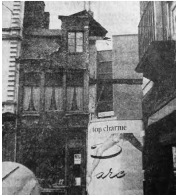
Afb. 2. Betonnen nieuwbouw zichtbaar na de afbraak van de ene huishelft (foto uit het in de tekst vermelde krantenartikel bewaard in het documentatiecentrum DSMG, Sint-Amandsberg, zonder aanduiding van datum en herkomst. De journalist tekende met de afkorting Fe.)

Er zijn in Gent tientallen gebouwen, meestal herenhuizen, die oorspronkelijk aan één eigenaar toebehoorden en later hetzij door erfenis, hetzij door verkoop