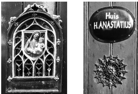
Nog aanwezige spionnetjes in het Klein Begijnhof

Voegen we hier nog aan toe dat boven elk spionnetje op een metalen plaatje de naam prijkt van de heilige aan wie het huis of het convent (gemeenschaps-huis) toegewijd is. Soms is er bovendien nog een geschilderde afbeelding van de huisheilige bij aangebracht. De deuren zelf zijn voorzien van verticale beplanking. Veel ervan dragen (anno 1905) nog de originele sleutelplaatjes en handvaten.