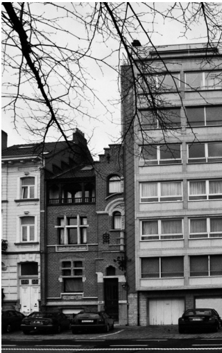
Afb. 1 Citadellaan 59

Een fraaie creatie eveneens uit jaren 1970 aan de Citadellaan: de helft van het huis in 1901 gebouwd naar ontwerp van bouwmeester Jacques Semey met