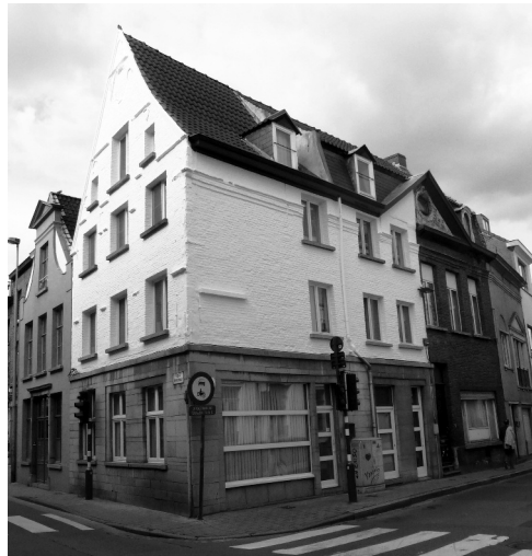
Afb. 2 Peperstraat 1-3