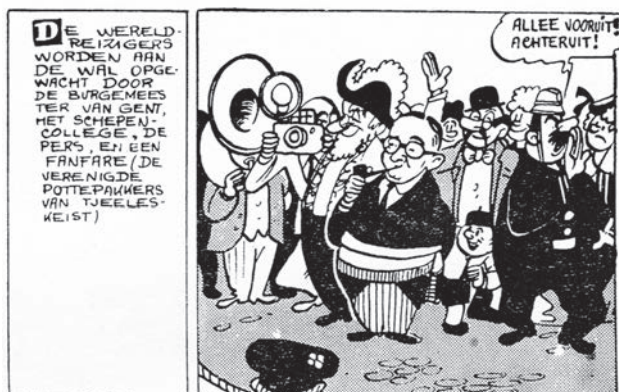
Afb. 1. Beo de verschrikkelijke, 215

Zoals we hierboven al aangaven zijn het vooral de Nero-afleveringen uit de jaren '50 die een uitgesproken Gents cachet vertonen. Dit zien we mooi geïllustreerd op afb. 1 met een verwijzing naar de Gentse stadswijk Seleskest. Bij ontvangstcomité toenmalig burgemeester Emile Claey's – niet toevallig promotor van het kanaal Gent-Terneuzen (uit: Beo de verschrikkelijke , 215).