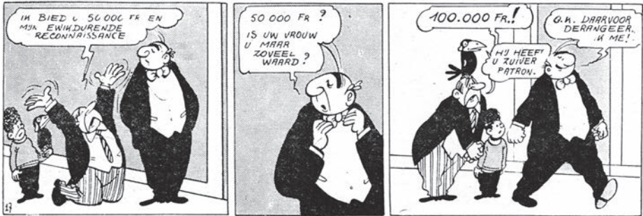
afb. 3. uit De gouden vrouw, 17.

Oliepulle (dronkaard): de naam van het personage kapitein Oliepul (vanaf De groene chinees, 1954).