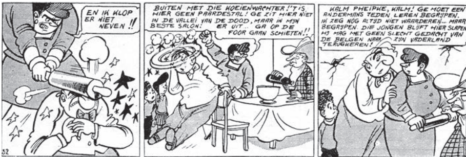
afb. 9 uit Het ei van oktober, 32

Nero, tot klein Japans meisje: “Waarom die traantjes, mijn zoet spleetooke? ” ( De groene Chinees , 113). Afb. 9 uit Het ei van oktober, 32: Nero’s nuancerende tussenwerping ( “ik zeg nog niet altijd waardenen...”) plus dit hele verzoenende betoog: heel Gents aandoende dialoog.