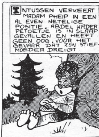
afb. 8 uit De bronnen van Sing-Song-Li, 87.

Iemands naam combineren met die van een beroemdheid als men er een eigenschap (positief / negatief) of een voorval aan wenst te verbinden: afb. 8 uit De bronnen van Sing-Song-Li, 87. Abdel Kader Petoetje : naar Abdel-Kader-Zaaf , de onfortuinlijke Algerijnse tourrenner die in 1950, het jaar voordien, tijdens de rit Perpignan-Nîmes onder een boom in slaap was gevallen (naar gelang van de bron: door wijn van toeschouwers of door een overdosis pepillen, hem verstrekt door een mederenner). Dit is nota bene niet Petoetjes voornaam, zoals sommige commentatoren, onbekend met deze gewoonte, uit deze passage afleidden.