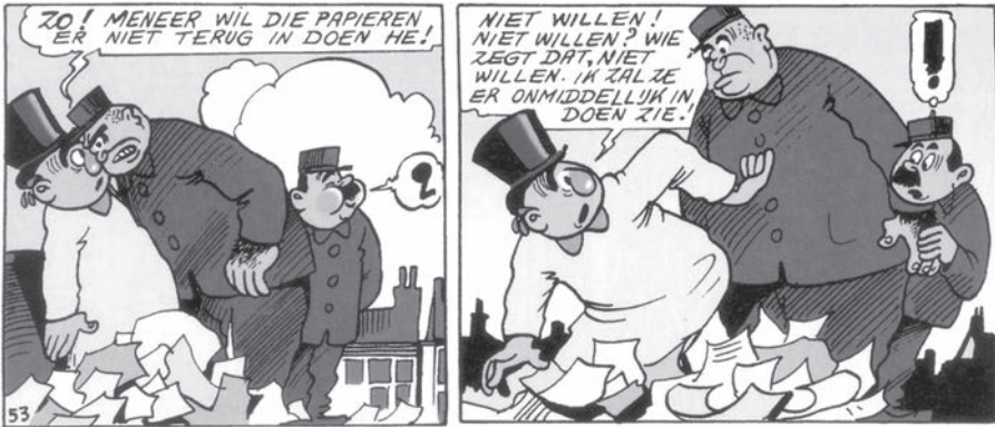
afb. 7 uit De hoed van Geeraard de Duivel, 53

Iemands naam combineren met die van een beroemdheid als men er een eigenschap (positief / negatief) of een voorval aan wenst te verbinden: afb. 8 uit De bronnen van Sing-Song-Li, 87. Abdel Kader Petoetje : naar Abdel-Kader-Zaaf , de onfortuinlijke Algerijnse tourrenner die in 1950, het jaar voordien, tijdens de rit Perpignan-Nîmes onder een boom in slaap was gevallen (naar gelang van de bron: door wijn van toeschouwers of door een overdosis pepillen, hem verstrekt door een mederenner). Dit is nota bene niet Petoetjes voornaam, zoals sommige commentatoren, onbekend met deze gewoonte, uit deze passage afleidden.