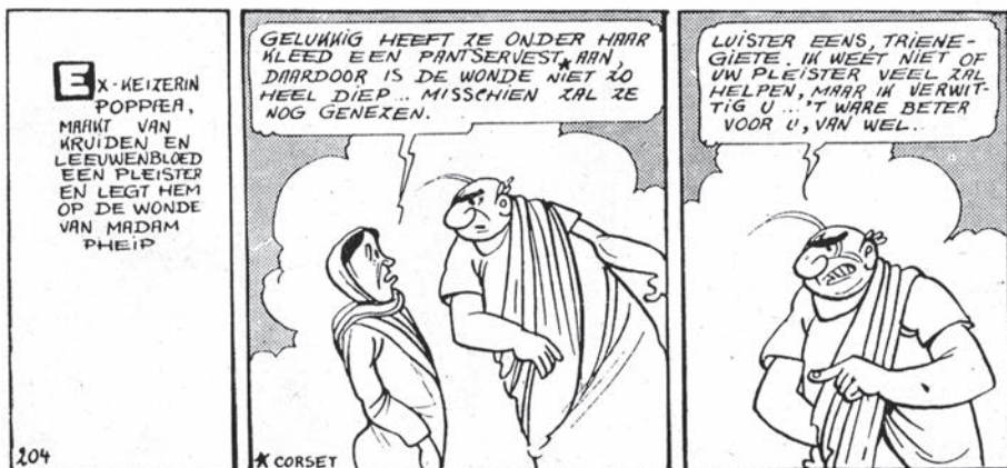
afb. 5 uit De rode keizer , 204.

“ Taas faatelak e Gehaam ... ” : 6 afb. 6 uit Het knalgele koffertje (1958-59).