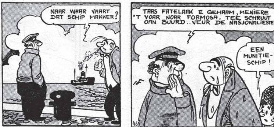
afb. 6 uit Het knalgele koffertje

Feitelijk : “Madam, ik zou feitelijk tegen u niet meer mogen spreken... Ik ben nu zo een beroemdheid. Zo een gevraagd artist.” (De daverende pitteleer, 55).