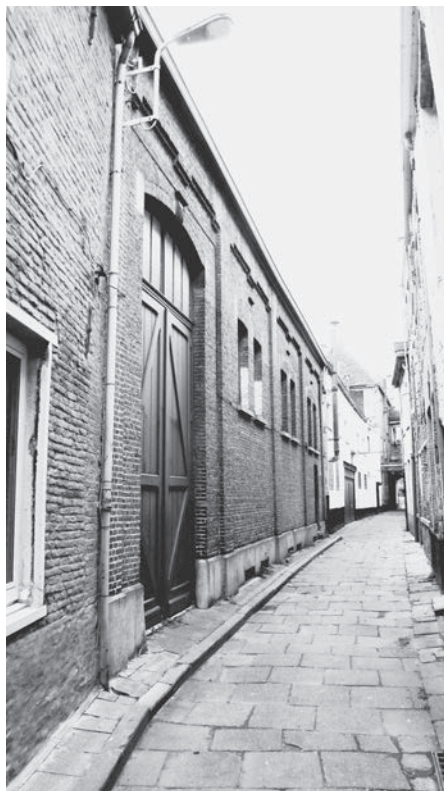
Afb. 4. Rechts: Garensteeg, voordien Engelsteeg en nog vroeger Contentast. Het Stantvedestraatje, dat verdween bij de grote kaalslag van de hele buurt in 1909, lag ter hoogte van de hoge poort links (foto 2014).

Gent spande blijkbaar de kroon voor wat dergelijke straatnamen (en dat soort activiteiten?) betreft. Naast de twee die zich tot op heden konden handhaven, weliswaar deerlijk misvormd, was er aan de Kouter nog een derde