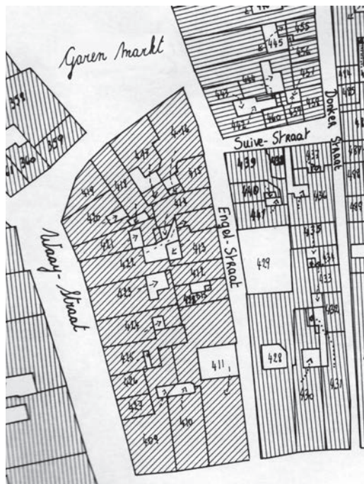
Afb. 5. Het Engelstraatje ex Contentast parallel met de Waaistraat tussen de Vrijdagmarkt (onder) en de Garenmarkt (nu Edward Anseeleplein). Het Stantvedestraatje vormde een korte verbinding (hier Suivestraat) tussen de Garensteeg en de verdwenen Donkersteeg (detail van een kopie van het eerste kadasterplan Sectie B, blad 2, ca. 1830).

Dezelfde De Potter voegt er wel nog een variante op het thema 'schuddevede' aan toe, en wel bij een plek met een voorbestemde naam: de Contentast aan de Vrijdagmarkt. 5 De locatie werd in de 16 de eeuw ook nog aangeduid als 'Den Contentast achter de Vrijdachmaerct, haudende den houck van den