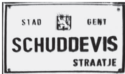
Afb. 1. Schuddeveesteeg aan de Graslei (foto 2014).