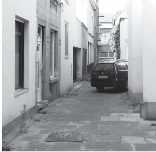
Afb. 7. Plumstraatje met rechtsonder het begin van het Varkensstraatje (foto 2014).

Zo zien we dat Gent net als andere steden vanouds typische prostitutiestraatjes had. Het waren kleine steegjes, maar ze lagen steevast vlakbij drukke markten en haventjes, later bij de grote treinstations. Zo lag ook het Antwerpse Schipperskwartier bij de oude haven en de Gentse rode buurt bij het oude Zuidstation.