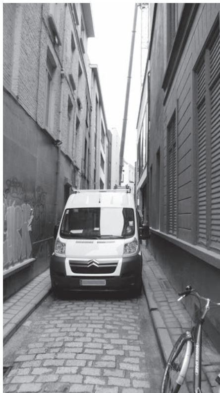
Afb. 3. Links: Klein Vleeshuissteeg, vroeger Schuddeveesteeg (foto 2014).

Blijkbaar bestonden er in de meeste van onze middeleeuwse steden dergelijke namen. 2,3 Ook in Veurne was het Schuddeveestraatje geworden en in Kortrijk Schuddevisstraatje. De Ieperlingen hadden het over een Streckeveitstraetkin of zelfs Reckeveitstraetkin. In Brugge vond men in archiefteksten zelfs vier dergelijke straatjes terug in heel diverse schrijfwijzen en vervormingen. Mechelen heeft nu nog steeds de straatnaam Schuttevee en in Brussel is er de Schuddeveldgang. Ook die laatste twee konden overleven dank zij hun volks-etymologische vermomming.