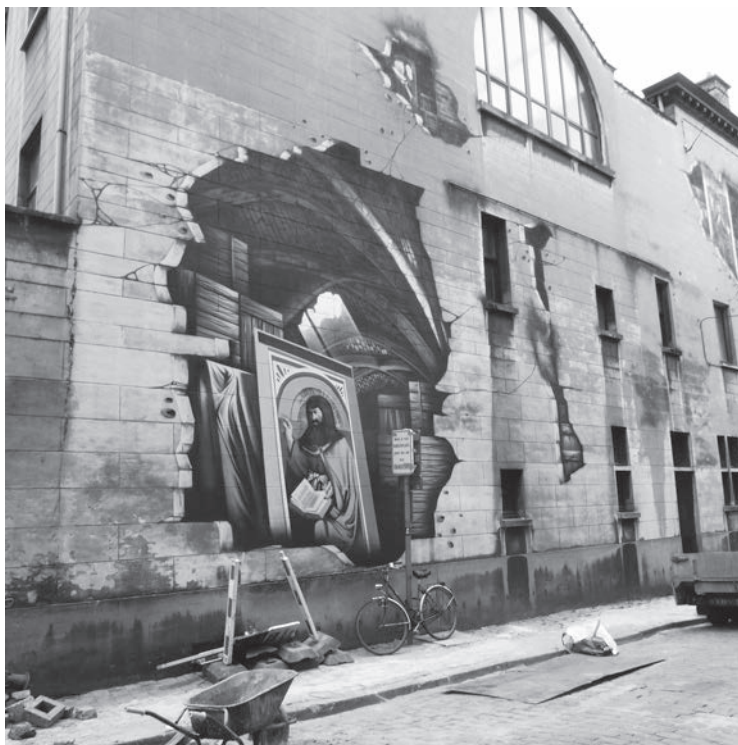
Afb. 1. De Jan van Stopenbergstraat anno 2014 opgesierd met een evocatie van het verbergen van de panelen van het Lam Gods tijdens WO II in een Duitse zoutmijn.

17/05/1920. Verhuring van het speelplein achter de Van Eyck zwemkom aan redersfirma Dens en Co. te Antwerpen in uitvoering van een akkoord van net voor de oorlog. Op de Nieuwbrugkaai heeft men reeds het gebruik aan verscheidene firma's toegestaan. Het belang van de handel vergt dat de stad zoveel mogelijk grond ter beschikking stelt van de binnenscheepvaart. Een speelplein behouden op die grond is niet logisch. Men zal zoeken naar een nieuwe plaats voor het speelplein.