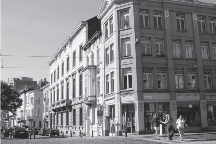
Afb. 2. Het hotel de Ghellinck de Walle aan de Recolettenlei waarin sinds 1920 de Kunst- en Letterrenkring (beter bekend als Cercle artistique et littéraire) huist.

17/05/1921. Na een ongeval in het lokaal van de Kunst- en Letterkring (Cercle artistique) op de Ketelvest was er geen degelijk lokaal meer voor schilders en kunstenaars en hun tentoonstellingen. De Cercle verwerft het hotel de Ghellinck de Walle aan de Recolettenlei om haar literaire en kunstzinnige zending voort te zetten. Voor een bebouwing op de koer in het Hotel de Ghellinck vraagt de vereniging een subsidie van 15.000 fr.