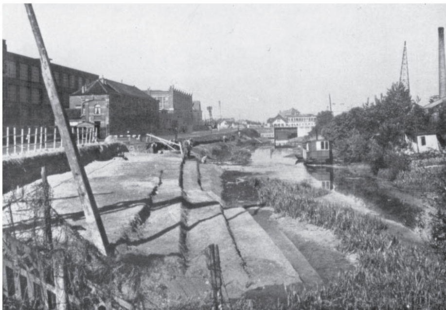
Afb. 1. Gezicht op de Aeroplaanlaan (Vliegtuiglaan) en het Omtrekkingskanaal of Ringkanaal, niet te verwarren met de grote Ringvaart uit de jaren 1960 (foto 1953 bij aanvang demping). Zie ook plannetje verder in dit artikel.

11/04/1921. Besluit tot verbreding van de Aeroplaanlaan (Vliegtuiglaan) tot 27 m. (Afb. 1)