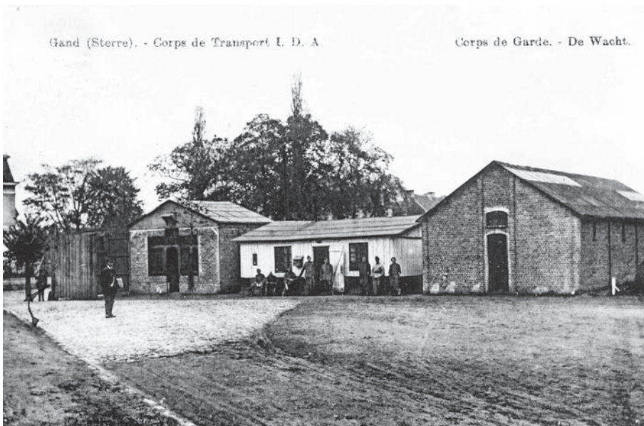
Afb. 7. Militair gebied op De Pintelaan 1924

5/09/1921. Om vrij over de gronden voor de Wereldtentoonstelling van 1913 te kunnen beschikken, sloot de stad Gent met de Staat op 13/07/1910 een overeenkomst met betrekking tot de militaire gronden aan de Sterre. Voor de artillerie bouwt de stad in de De Craeyerstraat (Leopoldskazerne) een voorlopige paardenstal met loodsen en afhankelijkheden. Door de oorlog was de geplande bouw van de kazernen aan de Sterre niet doorgegaan.