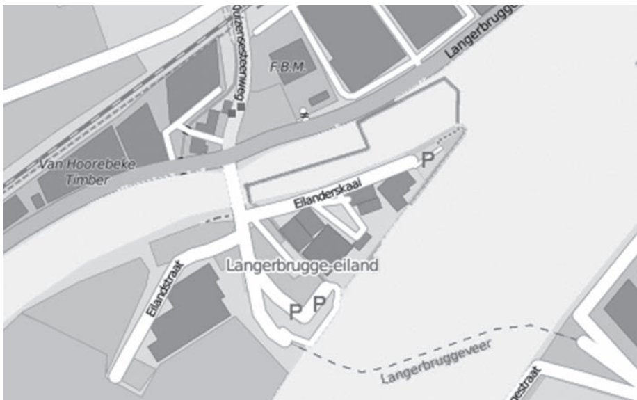
Afb. 4. Eiland van Langerbrugge.

28/11/1921. Nieuwe benamingen rond 'Langerbrugge: Eiland van Langerbrugge , eilandje gelegen tussen nieuw kanaal van Terneuzen en oude Sassevaart: Eilanderskaai gelegen langs oud kanaal van Terneuzen kant van het eiland van Langerbrugge: Uitwijkerskaai gelegen langs nieuw kanaal van Terneuzen kant van het eiland van Langerbrugge: Eilandstraat begint aan de Langerbruggestraat ten westen van de oude brug van Langerbrugge en richt zich naar het zuiden van het eiland van Langerbrugge. (Afb. 4).