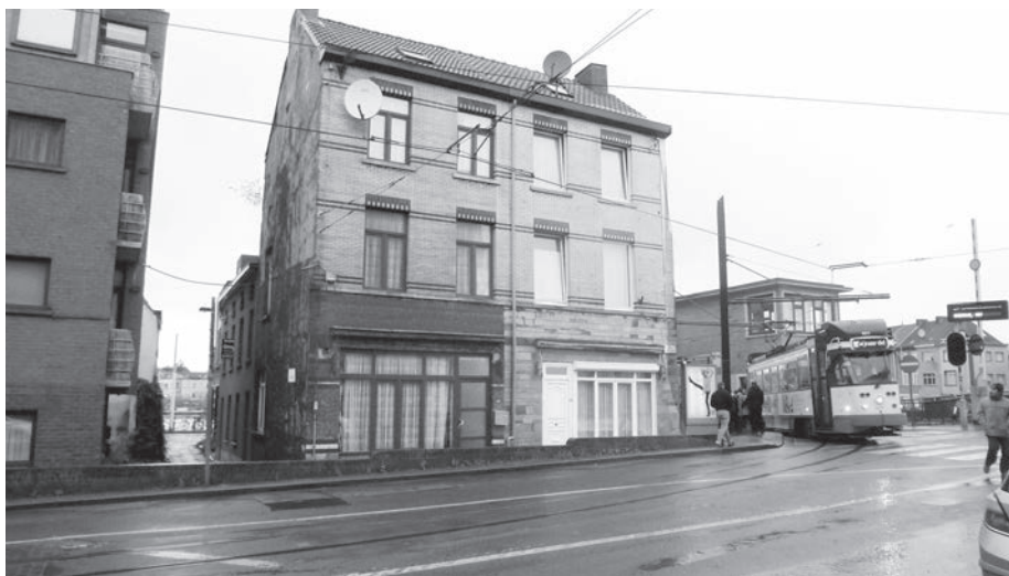
Afb. 3. Sluismeesterstraat vanop de Voormuide met rechts tram en bruggewachtershuis nabij de Muidebrug