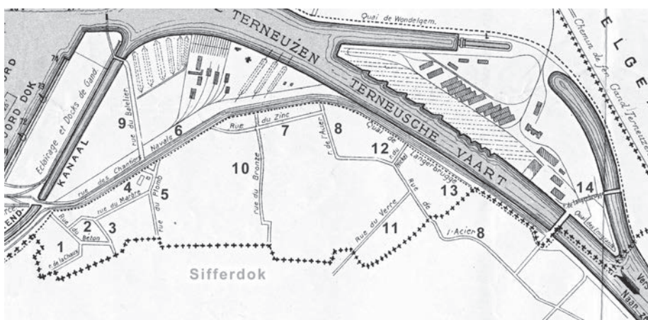
Afb. 6. Het huidige Sifferdok werd aangelegd doorheen de nrs 7, 10, 5 waardoor een reeks straten zoals de Loodstraat 5, Zinkstraat 7, een deel van de Scheepszatestraat 6, Marmerstraat 4, Betonstraat 2, enz verdwenen.