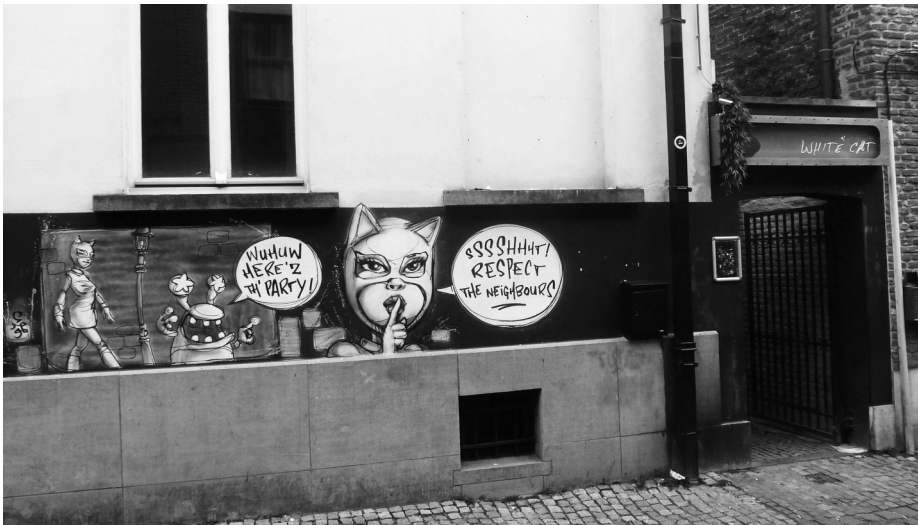
Afb. 7. Kelderingang aan het Drongenhof (foto 2014).

Omdat er van de toestand van 1713 te weinig sporen overbleven, kon bij de restauratie in 1984 onmogelijk het 18 de -eeuws gebouw gereconstrueerd worden. Vertrekkend van de 16 de -eeuwse kelder, langs de aan de zijkant bewaard gebleven 18 de -eeuwse trapgevel, de ingrijpende 19 de -eeuwse veranderingen tot en met de 20 ste -eeuwse art nouveau elementen, probeerde de restauratie de