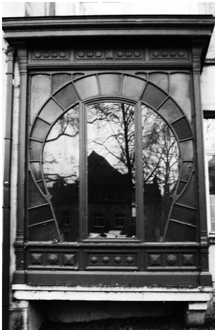
Afb. 5. Actueel uitzicht aan de vroegere Schipgracht, nu parkje aan de Sluizenkaai (2014).

Dit hoekpand heeft nooit iets te maken gehad met het refugehuis van de Drongense Norbertijnerabdij aan de overzijde van de straat Drongenhof. De functie van het gebouw moet in verband gebracht worden met de handel- en stapelactiviteiten eigen aan de nabijgelegen Zeeuwschen Aert. Dit haventje aan het Sluizeken kreeg die benaming omdat er, zoals aan de Lievekom, veel goederen uit Zeeland en Holland via de Sassevaart en de Schipgracht werden aangevoerd. Hiervan getuigen Den Hollandschen Waeghen en Vlissingen, namen van de herbergen die daar in de 18de eeuw gevestigd waren. Er werd onder andere wijn en vis gelost, maar op kleine schaal, want er stond geen kraan om zware tonnen op te hijsen. De middeleeuwse naam Torfbriel duidt op de functie van aanvoerhaven en stapelplaats voor turf, de vrijwel enige en heel belangrijke huisbrandstof aangevoerd via de Schipgracht vanuit het moereengebied in het noorden.