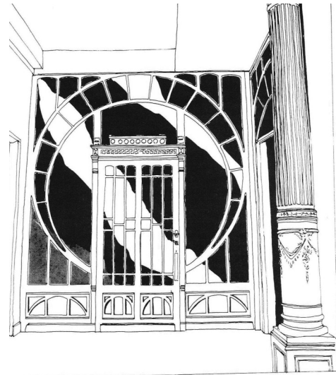
Afb. 6. Loggia in de hal binnenin (tekening Dirk Laporte, 1983)