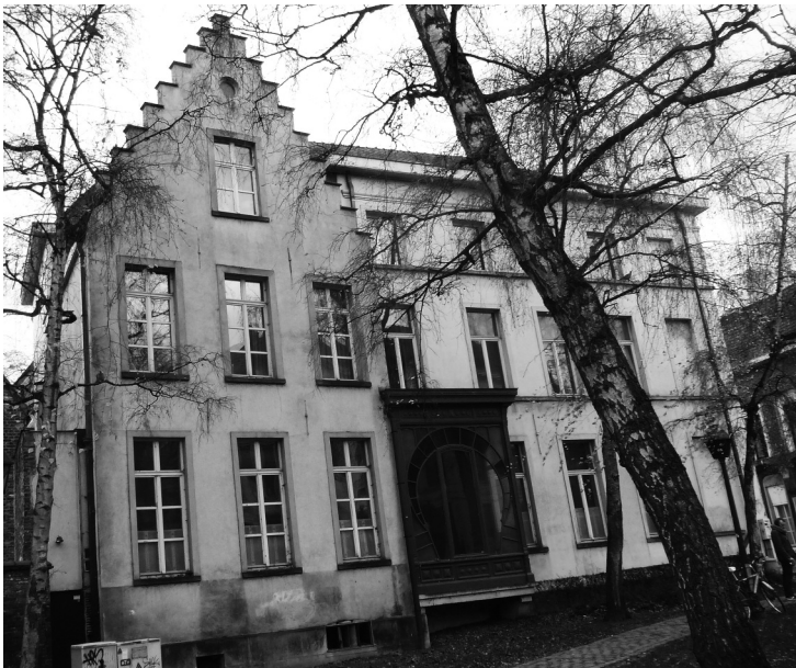
Afb. 4. Gevel Sluizekenkaai. (foto 2014).