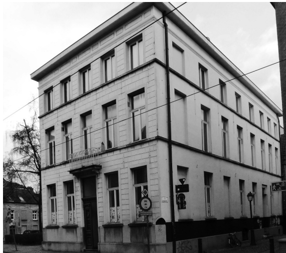
Afb. 1. Actueel uitzicht van het huis Mispreuve (foto 2014 genomen van op de Lange Steenstraat).

Het grote pand op de hoek van de Lange Steenstraat 60-66 en Drongenhof 42, het huis genoemd naar de bouwer wijnhandelaar Mispreuve, was in die tijd een op het eerste gezicht weinig opvallend hoekhuis. Tot in 1838 toen het gebouw grotendeels het nu nog bestaande typisch 19de-eeuws uitzicht kreeg (afb. 1), was het een indrukwekkend groot gebouw met drie bouwlagen, vermoedelijk onderverdeeld in een woonhuis en een magazijn, later twee woonhuizen.