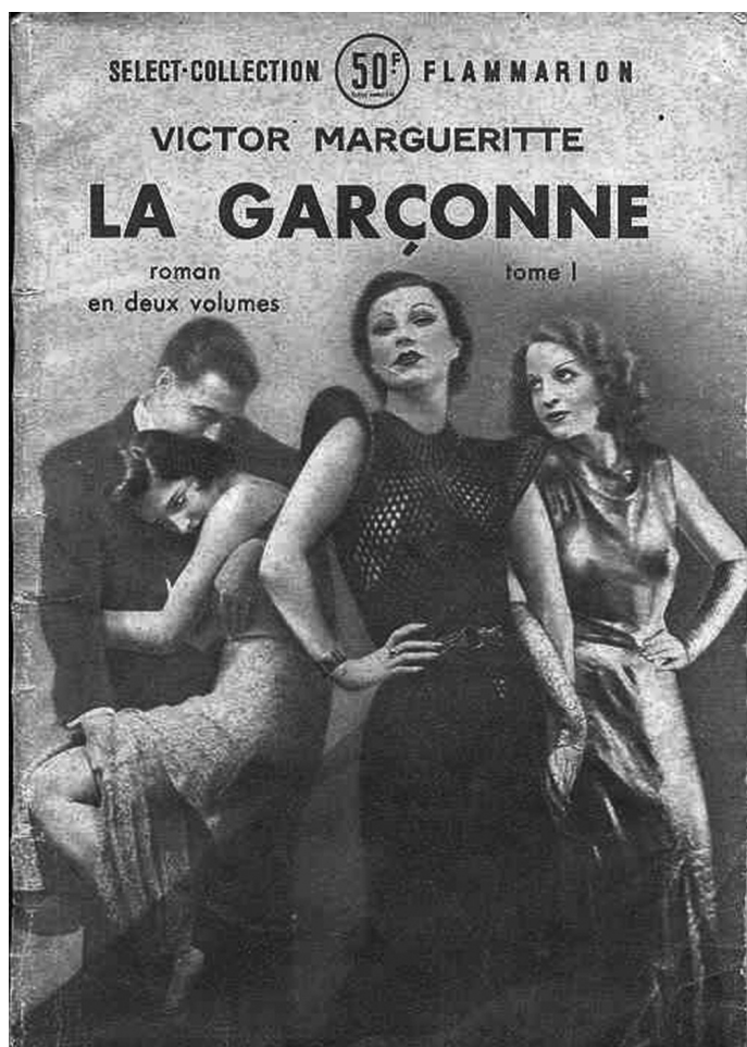
Afb. 2. Cover van de eerste aflevering van La Garçonne