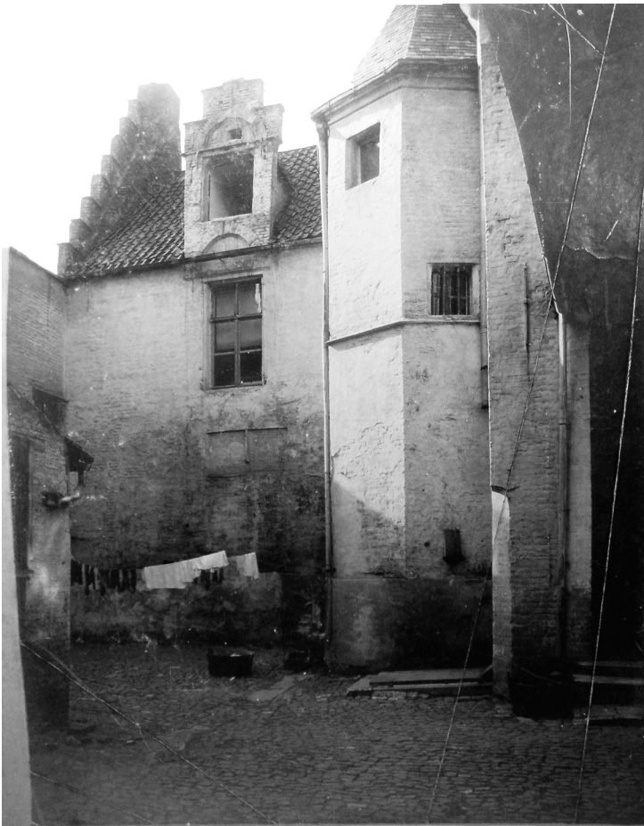
Afb. 4. De binnenkoer van 'Calvarieberg' in de Regnessestraat.

Steyaert verwijst naar een klooster by St. Baefskerk van reguliere kanunniken van St. Augustinus , gezegd Regnessen , die daar zouden verbleven hebben.