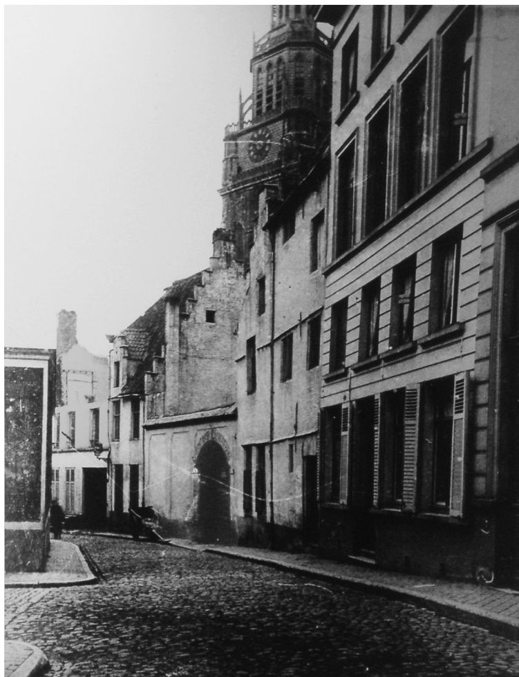
Afb. 3 Toegangspoort Calvarieberg rond 1897 (SAG SCMS 4904).

voudsvorm Regnessen. In de negentiende-eeuwse Franstalige documenten gebruikt men ook de meervoudsvorm Régnesses. De hedendaagse Nederlandstalige schrijfwijze is meestal een enkelvoudsvorm: Regnesse (12).