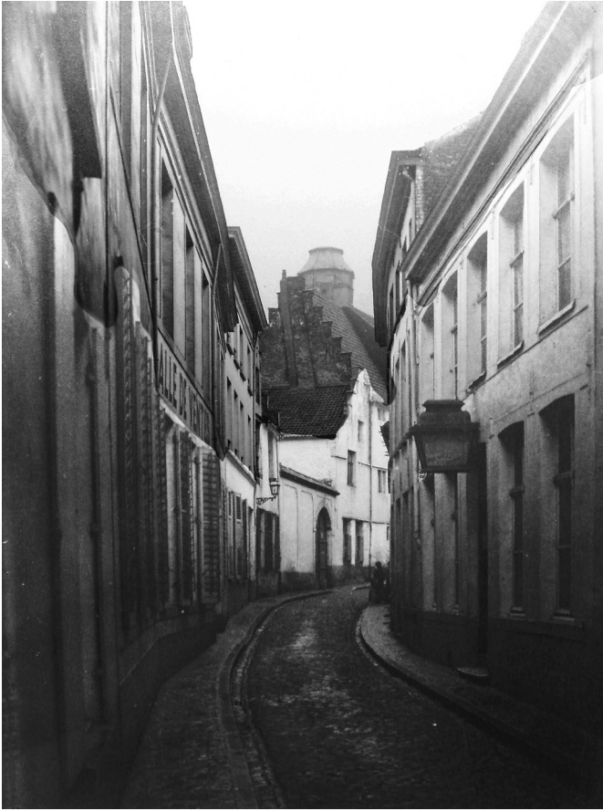
Afb. 1 De Regnessestraat vóór de afbraak. Vergelijk met volgende foto en neem het torentje als herkenningspunt.