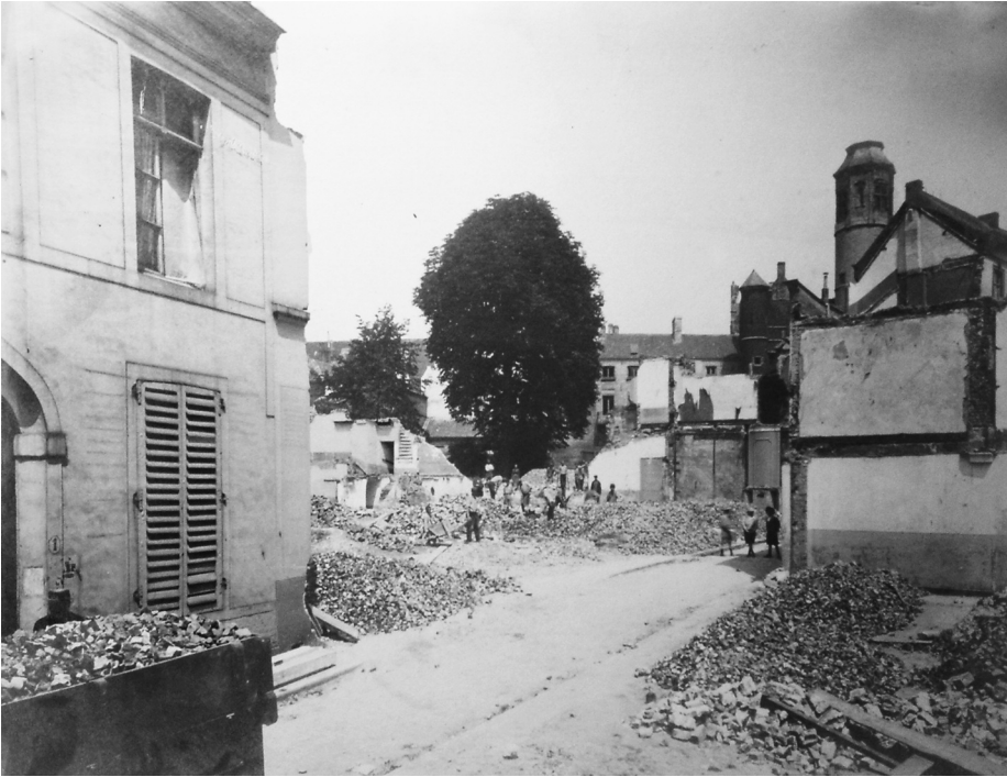
Afb. 2. Regnessestraat tijdens de afbraak, zie vorige foto.

onvoldoende. Materiële getuigenissen over deze te verdwijnen buurt moesten zorgvuldig vastgelegd worden. Dit was een dringende zaak, want (...) ce joli coin de solitaire intimité, cette mystérieuse rue des Régnesses, (...), va être anéanti (9).