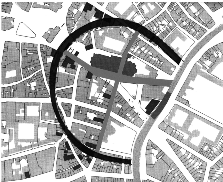
Afb. 5. Ringvormige gracht volgens de jongste hypothese (Van De Walle A.L.J., De Gentse Portus aan de Reep , in: Demey, A (alg. leiding), De Gentse Portus aan de Reep , een historische verkenning, p. 15).

En verder vallen binnen deze ringgracht de aanwezigheid op van de oudste kerk van Gent, de Sint-Janskerk (heden de Sint-Baafskathedraal), de mogelijk oudste vergaderplaats van de schepenen of van de vierschaar voor de kerk (22) en het Geraard de Duivelsteen met zijn donjon-kern, die op een nog oudere andere functie dan die van de dertiende-eeuwse adellijke woonst wijst (23). De aanwezigheid van het Kalandehuis (eerste vergaderplaats van de kooplieden) binnen die grachtencirkel is een bijkomend argument.