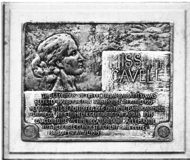
Afb. 1. Gedenkplaat van 1924 ter ere van Edith Cavell, Kortrijksesteenweg 128, Gent. De bronzen gedenkplaat is tegenwoordig ingewerkt in de blauwe hardstenen voorgevel van een apotheek, die het hoekhuis met de Bалиestraat vormt.

Op 12 oktober 1915, dus honderd jaar geleden, werd de Britse verpleegster Edith Cavell (1865-1915) te Schaarbeek gefusilleerd door een Duits vuurpeloton. Zij staat bekend als verpleegster die een humanitair ontsnappingsnetwerk voor geallieerde militairen opzette en werd daarvoor ter dood veroordeeld door de Duitse bezetter. Cavell is één van de symboolfiguren van de Eerste Wereldoorlog. Haar executie maakte over gans de wereld heel wat emotie los tegen de Duitse 'Hunnen', in het bijzonder in de Anglo-Saxische wereld. In de maand oktober werd dit 'eeuwfeest' wereldwijd uitgebreid herdacht. Zie bijvoorbeeld het Brusselse programma: http://www.edith-cavell-belgium.eu/nl/index-nl.html . Op 12 oktober vond er zelfs een uitzonderlijke plechtigheid plaats in de Belgische Senaat in aanwezigheid van Prinses Anne van Engeland. Over Edith Cavell in Gent werd daar zeker niet gesproken. Edith Cavell in Gent? Hoe kan dat?