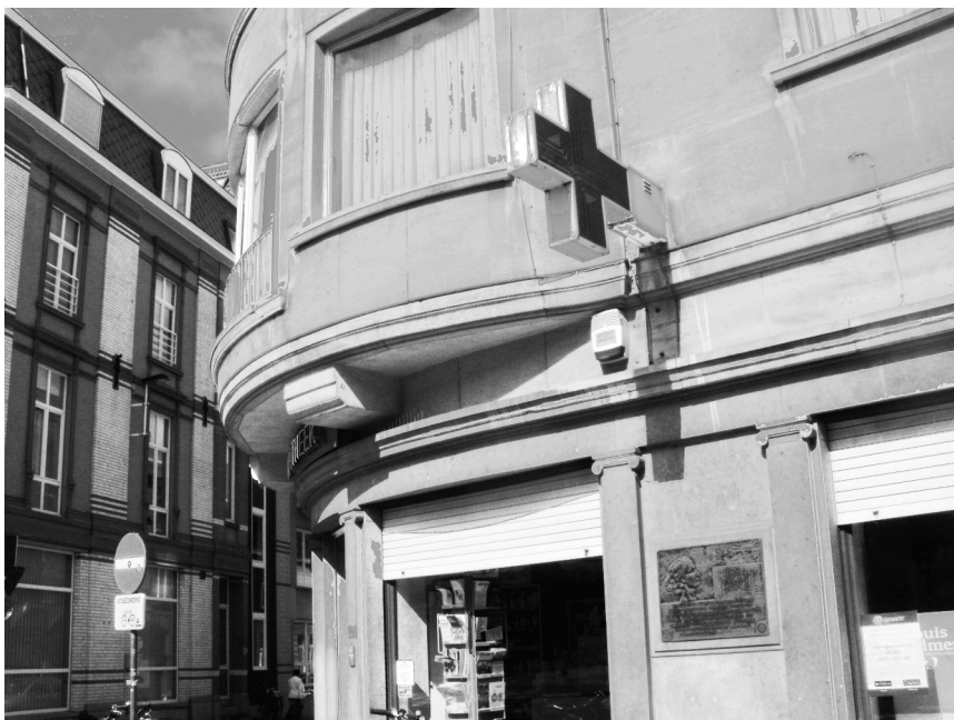
Afb. 2. De hoek Kortrijksesteenweg- Baliestraat waar tot in 1958 de herberg ‘De Stad Oudenaarde’ stond.

Over Edith Cavell als verpleegster en verzetsstrijdster is al heel wat gepubliceerd (zie bibliografie achteraan). Waar echter nauwelijks werd over geschreven is het feit dat haar verhaal ook een belangrijk Gents kantje heeft. Een gedenkplaat aan de voorgevel van apotheek Clopterop op de Kortrijksesteenweg nr. 128, aan de hoek met de Baliestraat, vermeldt in drie talen onder het opschrift Miss Edith Cavell: ‘Het glorieijke slachtoffer der Duitsche Barbaarscheid werd in dit huis heimelijk geherbergd in april 1915 ‘ (zie afb. 1). In 1924 werd ze op deze hoek aangebracht aan de in 1958 gesloopte herberg ‘De Stad Oudenaarde’ (in het Frans ‘Ville d’Audenarde’). Dit gebouw had toen het huisnummer 54 en werd volgens de Dubbele Wegwijzer van Gent eerst uitgebaat door F. Velghe († 1912) en tussen 1911 en 1925 door het gezin Gustaaf Steurbaut-Impens. De bronzen plaat hing oorspronkelijk in de Baliestraat (zie afb. 6) en hangt nu op de gevel van de ‘Residentie Edith Cavell’ in de Kortrijksesteenweg (afb.2). In 1924 vroegen inwoners van de Baliestraat aan het gemeentebestuur om hun straatnaam te veranderen in ‘Miss Cavellstraat’ als blijvende hulde aan de nagedachtenis van de heldin-martelares. Op dit verzoek werd toen niet ingegaan.