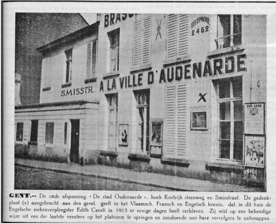
Afb. 5. Een lokaal krantenknipsel (jaar niet gekend; voor 1958) met de gedenkplaat. Per vergissing wordt de Bалиestraat op de foto aangeduid als Smisstraat. (dig. verz. AB).