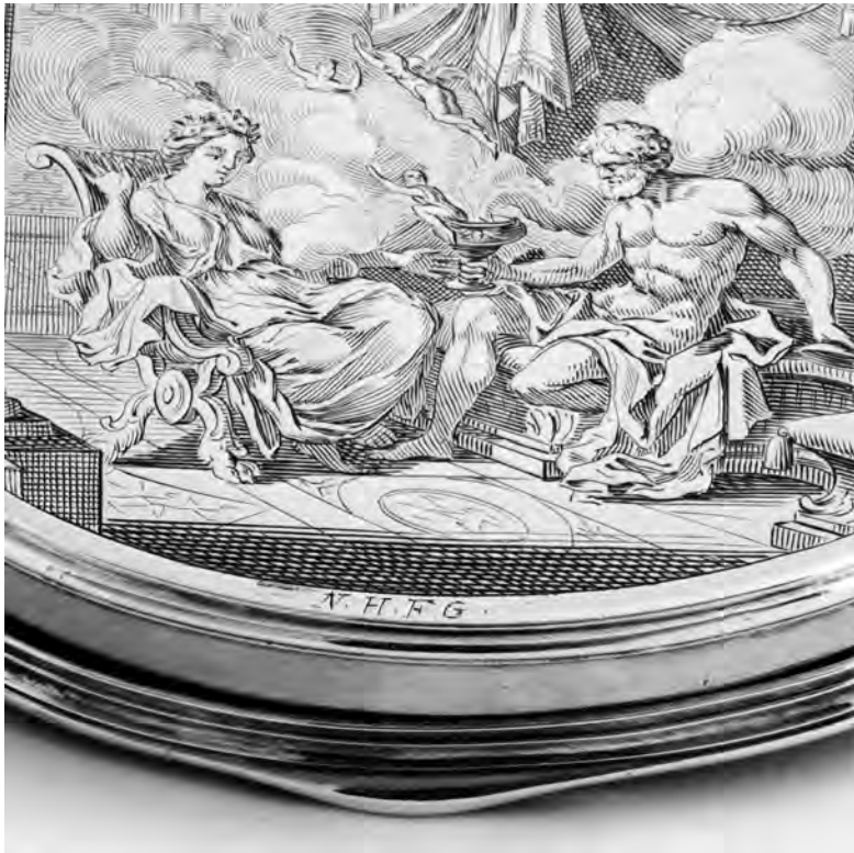
Afb. 7 signaturen