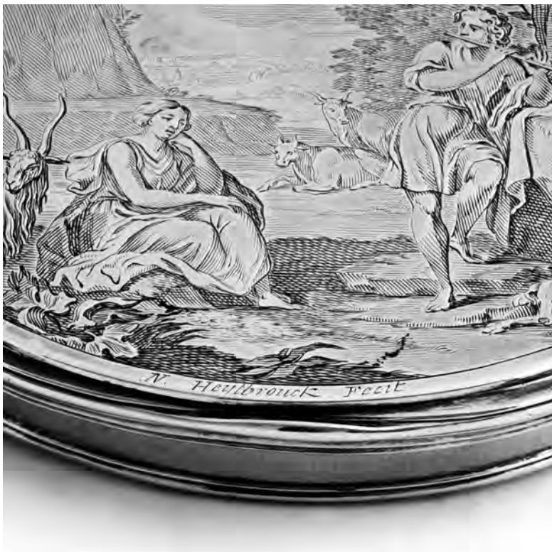
Afb. 6 signaturen