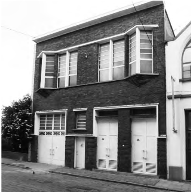
Afb. 1. Bomastraat (foto 2015)