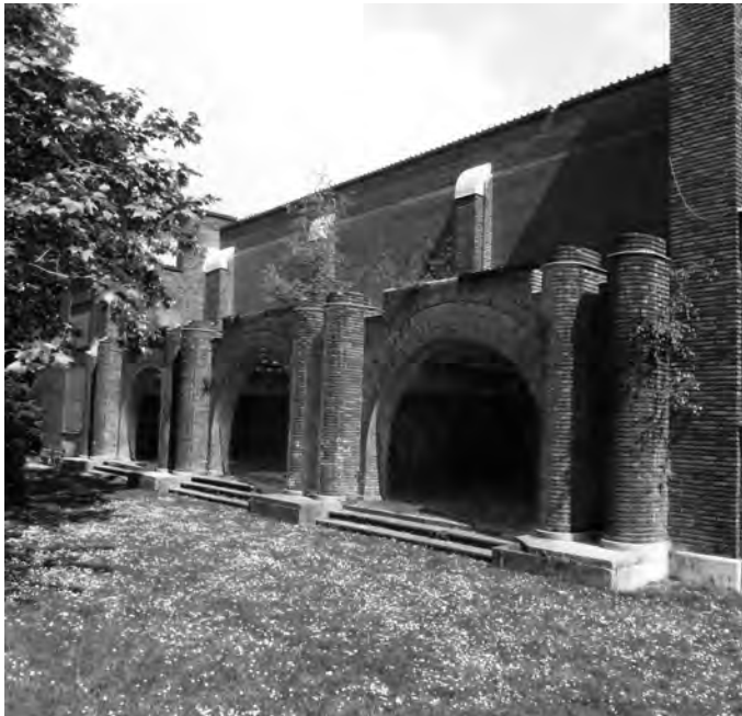
Afb. 4. Kwakkelstraat, zijde naar de Gebroeders De Smetstraat, laagbouw gedeelte (foto 2015).