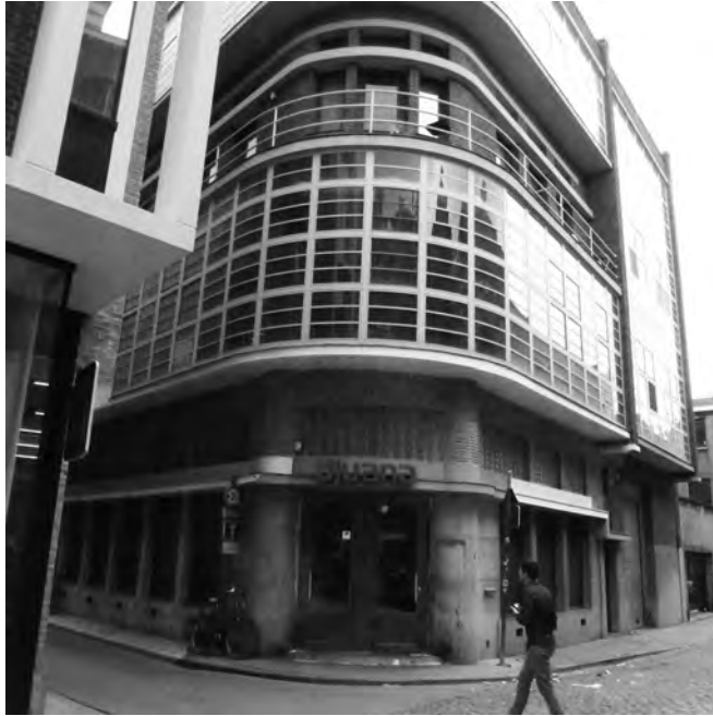
Afb. 3. Hoek Jan van Stopenberghe – Schuurkensstraat (foto 2015)