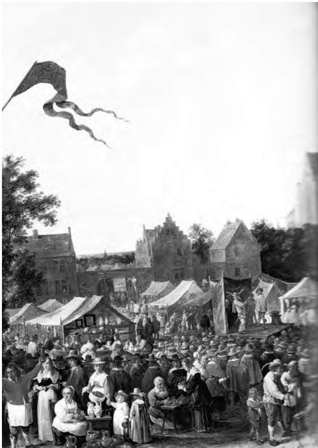
Afb. 1. Detail uit het schilderij van David Teniers de Jonge (privébezit) met de Kloostermarkt, de Gentse zomerfoor of Potjesmarkt in de jaren 1600 op het kerkhof van de Onze Lieve Vrouw Sint-Pieterskerk (nu Sint-Pietersplein).

De zomermarkt werd in de eerste eeuwen van zijn bestaan gehouden op het kerkhof van de parochiekerk O.-L.-Vrouw van Sint-Pieters (afb. 1). Dat zou niet mogen verbazen. In die tijd vormden de hoven rond het kerkgebouw vrije ruimten, meestal beboomd en omringd door een muur. Stenen grafmonu- menten waren enkel binnen in de kerken te vinden. Deze open plaatsen werden niet enkel als begraafplaats voor overwegend armelui gebruikt, maar ook voor van alles en nog wat, onder andere voor feestelijke activiteiten die we niet direct associëren met de ingetogen sfeer van begraafplaatsen. Zo ook voor de grote Gentse zomerjaarmarkt.