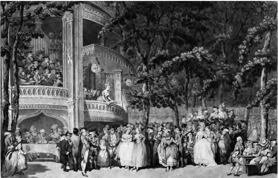
Afb. 1. Een Vauxhall in volle glorie door Rowlandson, Thomas (artist). Niet toevallig de Londense bakermat (Victoria and Albert Museum Collection, museum number 27607)

De Gentse Vauxhall was opgericht in 1782. Men gaf er bals en feesten die gefrequeenteerd werden door 'la bonne société de la ville'. Kort na 1830 werd de zaak opgedoekt. Hoewel veel gelezen auteurs als Prosper Claeys en Pierre Kluyskens er over schreven en de Vauxhall ongeveer een halve eeuw draaide, lijkt deze episode uit onze stadsgeschiedenis weinig gekend. Zelfs in het goed gestoffeerde boek De Coupure in Gent. Scheiding en Verbinding dat in 2009