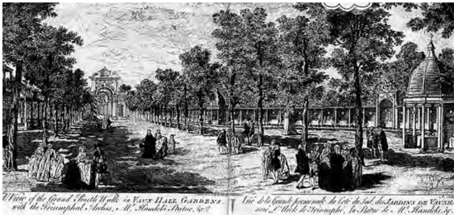
Afb. 2. De Grand South Walk afgezoomd door de Triumphal Arches in de Vaux Hall Gardens.

De bezoekers van het idyllische park, door de Engelsen 'pleasure gardens' genoemd, liepen er door nagemaakte ruïnes, triomfbogen en Chinese paviljoenen. Men woonde er muziek evenementen en vuurwerkspektakels bij (afb. 1). Het was een van de belangrijkste entertainmentplaatsen van het midden van de 17de tot het midden van de 19de eeuw.