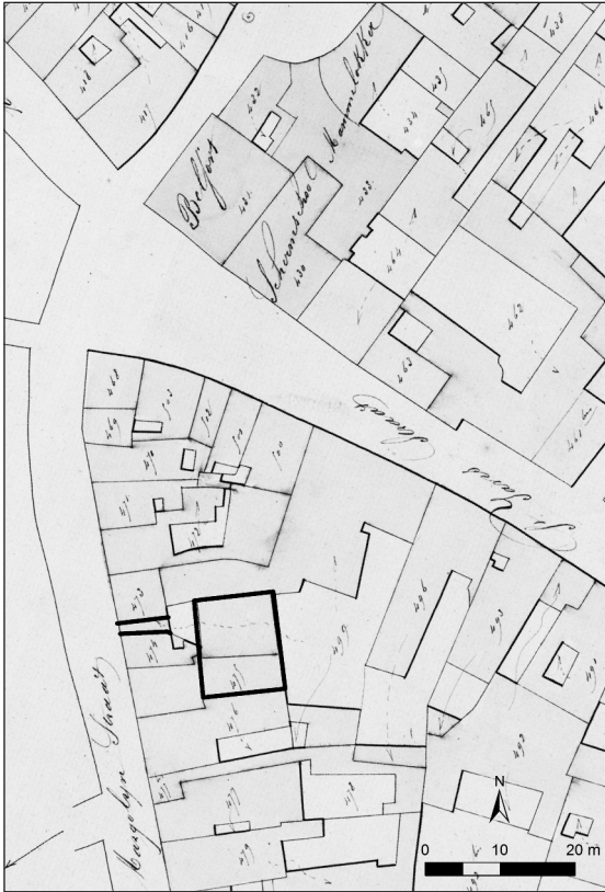
Afb. 1. Dik aangezet op het eerste kadasterplan (ca. 1830): Het theaterzaaltje en de toegang vanuit de Mageleinstraat: het Gangske in het bouwblok tussen de Mageleinstraat en het Belfort. Bemerkt dat dit niet rechtover de Bennesteeg gelokaliseerd was (Stad Gent, De Zwarte Doos, Stadsarcheologie).