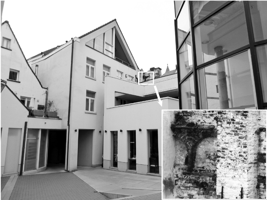
Afb. 6. Restant met de bogen van de zuidgevel, nu nog zichtbaar van op het binnenpleintje (foto Jos Tavernier, 2016).