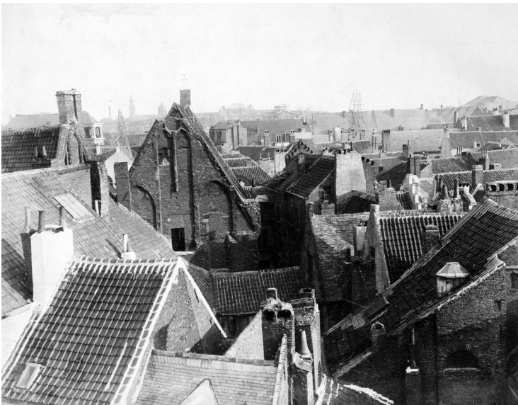
Afb. 7. Zicht van op het Belfort met de noordgevel van het pand prominent aanwezig.