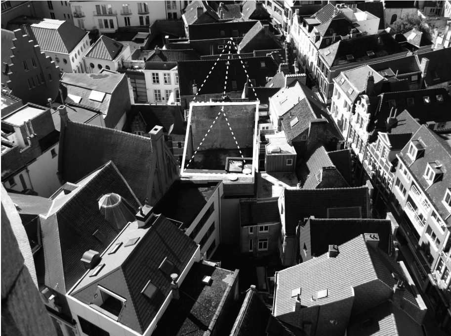
Afb. 8. Foto genomen vanaf ongeveer hetzelfde standpunt als het vorige (afb 7) op het Belfort met evocatie van het volume en de topgevels van het pand. De binnenkant van de bewaarde zuidgevel is goed zichtbaar. Rechts: de Mageleinstraat.

Bij het rondkijken ter plaatse, valt een treffende gelijkenis op in een nog bestaande buitenmuur zichtbaar van uit het Sint-Baafssteegje. Eureka! Het betreft een restant met bogen van de zuidgevel (afb. 6). Van op het Belfort krijgt men een duidelijk beeld van wat nog overblijft van de theaterzaal (afb. 7 en 8). Op de binnenplaats van het Hotel Van Branteghem kan je de binnenzijde van de zuidgevel zien, en ook een (vermoedelijke) restant van de westmuur (afb. 9).