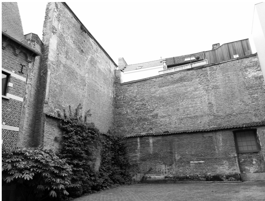
Afb. 9. Van op de binnenkoer van het pand Sint-Baafsplein 10 (Hotel van Brantegem) kan men nog goed het volume inschatten van het verdwenen gebouw, met links de binnenzijde van de bewaarde zuidoever en rechts de vermoedelijk bewaarde westelijke langzevl.