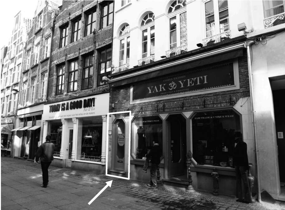
Afb. 3. De gang die zijn naam leende aan de zaal functioneert nu als toegang tot de appartementen van het huis Mageleinstraat 13.