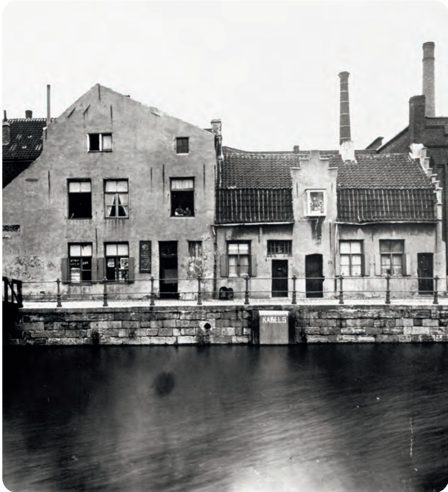
Afb. 16. Ook hierin is een citeetje herkenbaar aan het poortje onder de dakkapel.

In de tweede helft van de vorige eeuw werd de oudere bebouwing van de kaai-straat grotendeels afgebroken. Het ‘pittoreske beeld van de armoe’ (afb. 12 en 13) verdween geleidelijk aan. Het gildehuis doorstond als bij wonder alle mogelijke stormen. Na een geslaagde restauratie schittert het weerom in zijn oorspronkelijke rode gevelkleur en als imitatie witsteen vuurwapens. Met het andere oude erfgoed dat er, zoals de oude citeetjes (afb. 14, 15 en 16), niet prestigieus uitzag, werd allesbehalve zorgvuldig omgegaan. Het kon op weinig waardering en geld rekenen... jammer! Gelukkig is het complex nu grotendeels een fraai ingerichte woonzone, gedeeltelijk verborgen achter de be-