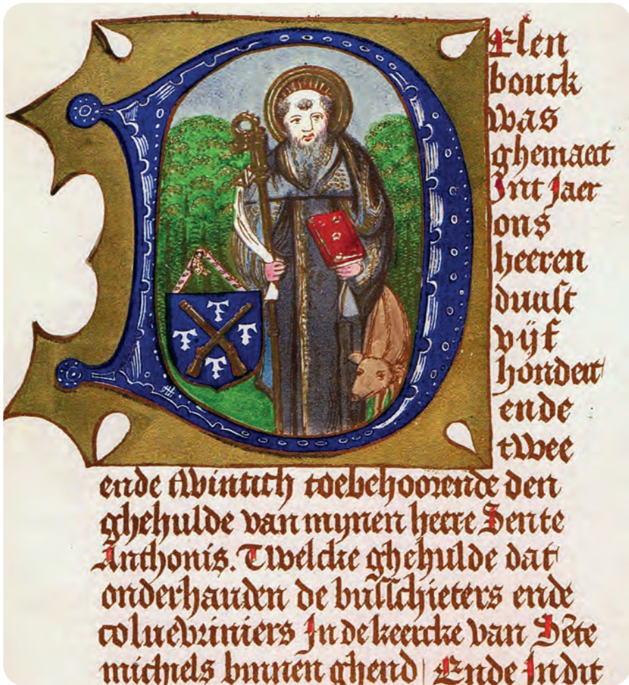
Afb. 2. Aanhef van het gilderegister uit 1522 (Stadsarchief Gent): ‘Desen bouck ...’. De versierde eerste letter (initiaal) D toont de heilige met zijn belangrijkste attributen (herkenningstekens): het varkentje, de abtenstaf en in het schild met gekruiste geweren: de letter T (overgenomen uit Vanderhaeghen, 1866).

Helemaal alleen wilde Antonius zijn als eremijt in de woestijn (Grieks: eremos), maar zijn levenswijze zou talrijke volgelingen aangetrokken hebben, bij zoverre dat er zich rond hem een gemeenschap van (vermoedelijk enkel) mannen verzamelde, waarvan hij als de ‘vader’ (Aramees: abba, vandaar Antonius abt) aanzien werd. Er zit dus een zekere tegenstelling in de twee titels abt en eremijt. De betekenis van deze Egyptische Antonius is niet gering omdat hij terecht of onterecht aanzien wordt als een van de stichters van het kloosterwezen en het monnikendom, ongemeen belangrijk in de Europese geschiedenis. Antonius is actueel meest gekend vanwege de voorstellingen op schilderijen