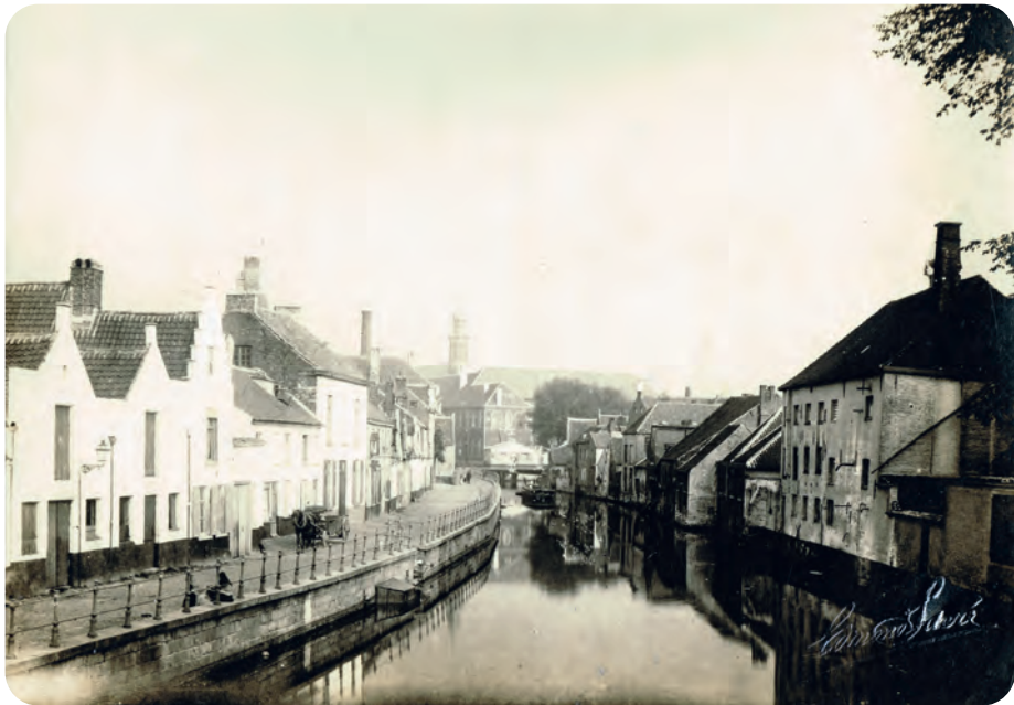
Afb. 13. Sint-Antoniuskaai zoals ze er lange tijd uitzag: met witgekalkte geveltjes.