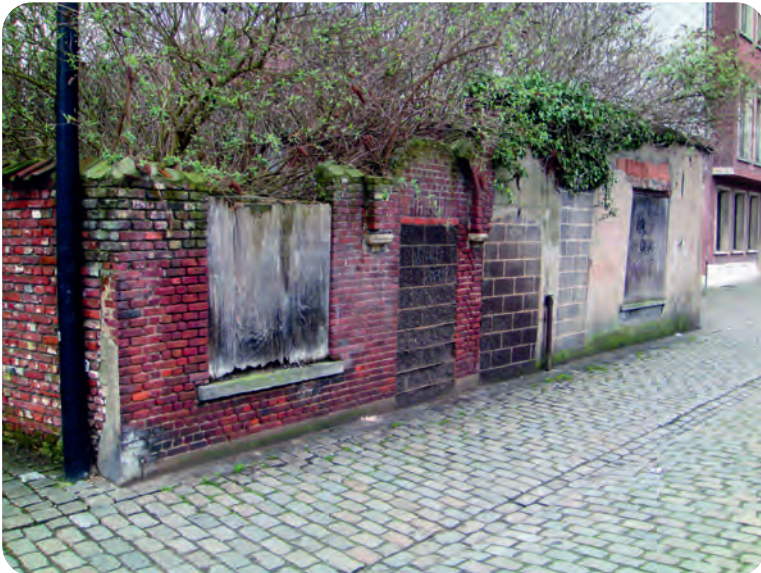
Afb. 15. Toestand in 2011 van dit bijna volledig afgebroken stukje erfgoed. De drie deuropeningen van afb. 14 zijn nog goed herkenbaar. Bemerkt de rooilijnverlegging uiterst rechts: fataal voor alle oude bebouwing en een schoolvoorbeeld van wat niet zoveel jaren geleden nog moest en nu gelukkig niet meer mag...