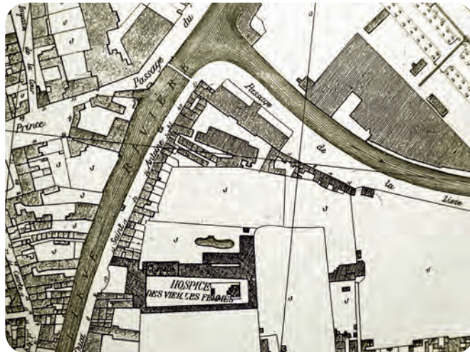
Afb. 10. De tot 'Hospice des vieilles Femmes' omgevormde Antoniusshof, goed herkenbaar achter het oude schuttersgebouw (Stadsplan van Gevaert en Vanimpe, 1878, kopie in DSMG). De Passage de la Lieve (Lievegang) bovenaan duidt erop dat de binnenvestgracht in die tijd ook Lieve genoemd werd. In de rechterbovenhoek de dubbele bomenrij van de Opgeëistenlaan. Er onder de textielfabriek gekend als Florida en UCO-De Hemptinne. Het gangske met beiderzijds kleine beluikhuisjes (toen Sint-Antoniusskaai nr. 30) werd 'De Konijnepijp' genoemd. Pogingen in 1976 om dit te behouden en te restaureren mislukten (zie o.m. Het Volk, 5 aug. 1976 en 5 nov. 1981).