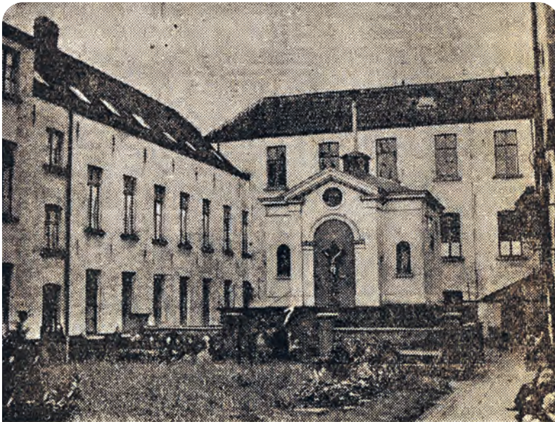
Het Sint-Antoniushof te Gent, gelegen aan de kaai die denzelfden naam draagt, thans een tehuis voor oude vrouwen, zal eerlang worden afgebroken. Het gebouw dagteekent uit de 16e eeuw

Gent hield aan het tijdverdrijf van de heren schutters, inclusief geestelijken, en blijkbaar ook dames, een imposant gildehuis uit 1639-1641 over aan de weg langs de Lieve. In de eerste decennia van hun bestaan als gilde verschooten de kolveniers hun poer aan de vest Einde Were op Ekkerghem (Vanderhaeghen, 1866 en 1867b). Dat vonden ze te ver afgelegen van het centrum en te dicht bij de vestorens waarin pestlijders opgenomen werden. Het stadsbestuur kocht in 1532 een groot terrein bij het Prinsenhof op een plek die toen bekend stond als Vogelenzang en stelde het ter beschikking van de gilde. De tijden werden echter al snel ongunstig voor dat dure tijdverdrijf - denk aan de bestraffing van Karel V en de calvinistische opstand – zodat het nog zowat een eeuw duurde vooraleer er opnieuw schot kwam in de schutterij (Steels, 1974). Na verkopen over en weer kwam het terrein in gildebezit en kon er gedacht worden aan het bouwen van een schutterslokaal, een naar prestige strevende vereniging waardig. De eerste steen werd in 1638 gelegd door de voorschepe-