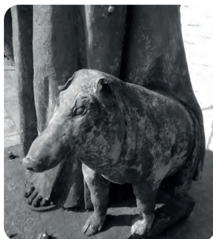
Afb. 1. Het 'zwijntje' van Sint-Antonius aan de ingang van de Cultuurkapel Sint-Vincent op de Sint-Antoniushof (foto 2018, detail).

Een van de meest populaire heiligen in onze streken was Sint-Antonius. Dat was een belangrijke vroegchristelijke figuur (derde-vierde eeuw) die in kerkelijke teksten meestal onderscheiden wordt van een andere Sint-Antonius ('van Padua') door de toevoeging eremijt of abt. De Antonius die ons hier bezig houdt, trok zich in een Egyptische woestijn terug en als werd als het ware de verpersoonlijking van de asceet, de heremiet of eremijt. Hij zou geleefd hebben van 251 tot 356, en dus 105 jaar geworden zijn. De heiligennaam kan dus tot verwarring leiden, vandaar ook de betiteling Antonius 'de Grote' of 'van Egypte' voor de sint in de titel hierboven. Daarmee zitten we al aan vier titels die deze heilige helpen identificeren. En dan is er nog een vijfde, de meest bekende: Antonius met het varkentje of Toontje met het zwijntje (afb. 1).