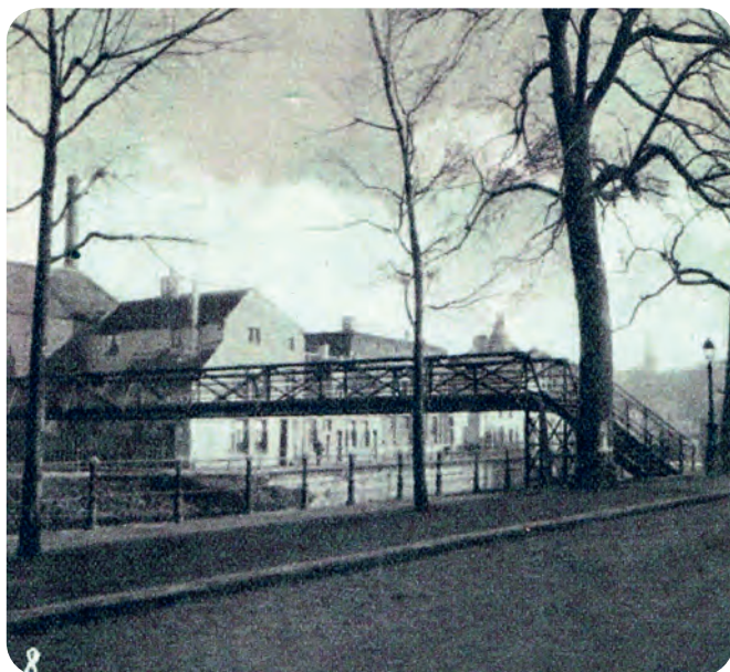
Afb. 11. Het ijzeren Sint-Antoniussbrugge uit 1888 (niet gedateerde foto uit een ons onbekend tijdschrift). Dit werd in 1953-1954 vervangen door de nog bestaande stenen constructie in pseudohistorische stijl à la Brugge (GT 1991, jg. 20, p. 293-295).