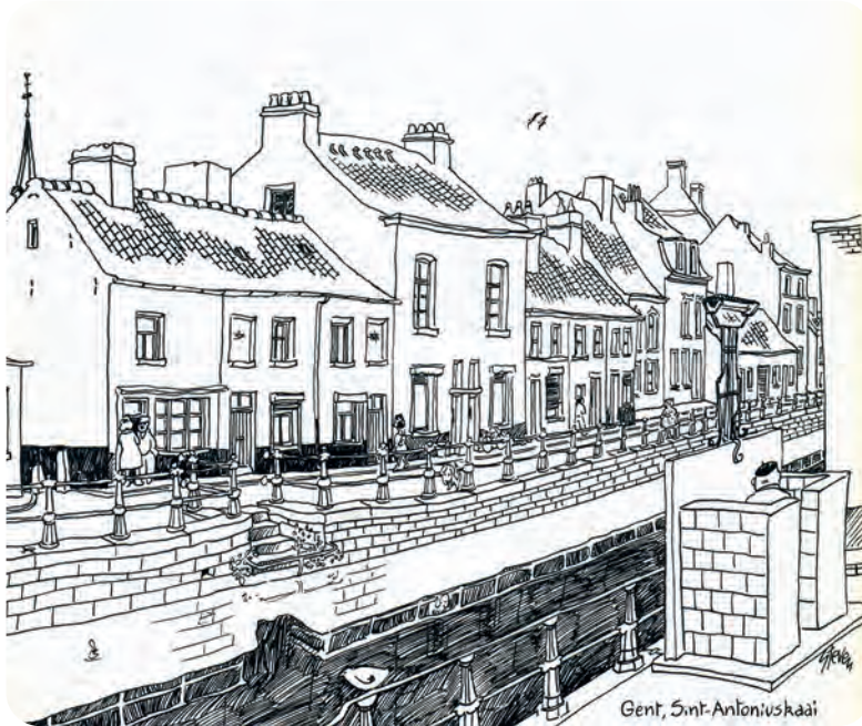
Afb. 12. Sint-Antoniuskaai in de typische tekenstijl van 'Steven' (uit Agenda 1984).