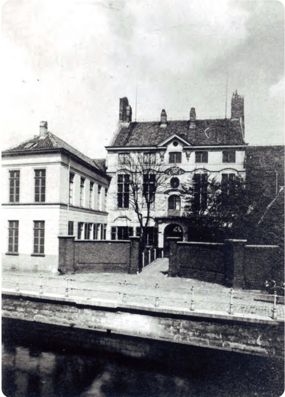
Afb. 6. Het hoofdgebouw van de schuttersgilde. Foto uit 1909 (collectie SCMS in Stadsarchief Gent). Links het optrekje van de aalmoezenier. Alles was, zoals toen gebruikelijk, wit gepleisterd.