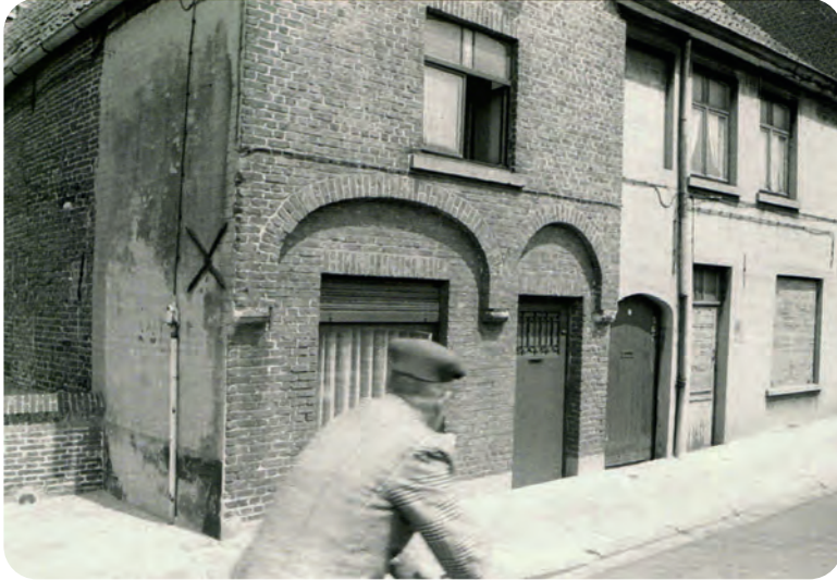
Afb. 14. Toestand in 1977 van de huisjes rechts (ten oosten) van het gildehuis met drie deuren naast elkaar. De middelste gaf toegang tot een 'poortje': een beluik met drie huizen: Sint-Antoniusskaai nr. 6, herkenbaar op het grondplan in afb. 9. Foto uit Moreau, R., 2003, Archiefbeelden Gent. Deel IV. Beluiken, poortjes en cités , p. 22. Daarin ook een foto genomen in het citeetje zelf. De (te hard gerestaureerde) overkragingen wijzen op 17de-eeuwse bouw. Vergelijk met afb. 15.