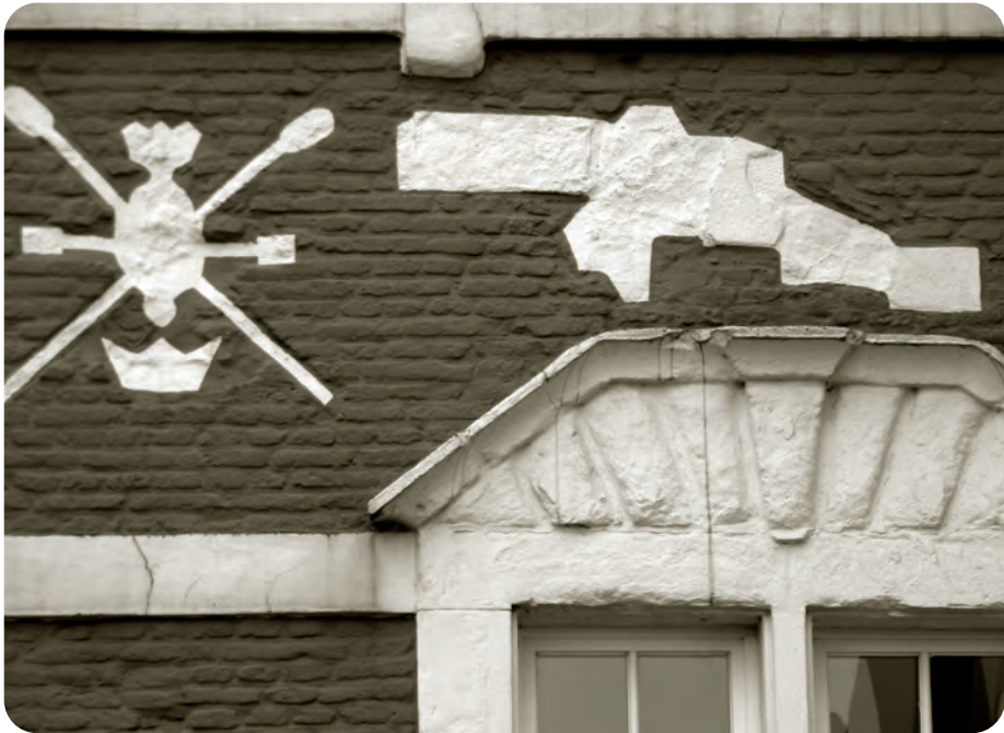
Afb. 4. In de gevelversiering van het gildehuis wilden de busseschieters graag uitpakken met hun pièce de résistance: een waarachtig kanon (foto 2018).

Iets moeilijker zit het met het patroonschap van Antonius voor de vierde Gentse gewapende gilde, die van de ‘busschieters’ of kolveniers, schutters met vuurwapens (afb. 2 en 3), officieel gesticht in 1488, maar al enkele jaren eerder actief (Vanderhaeghen, 1866 en 1867a; Nota’s van Werveke in Stadsarchief Gent). Ze vormden een stedelijke semimilitaire vereniging van gegoede lieden die zich in hun vrije tijd met vuurwapens amuseerden. Zelf betrokken ze liefst ook nog kanonnen (afb. 4) bij hun wapentuig, maar die werden enkel bij speciale feestelijke gelegenheden in stelling gebracht (Vanderhaeghen, 1867a).