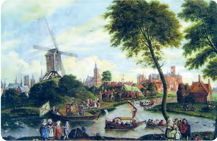
Afb. 9. Koningsschieting van de Sint-Antoniugilde gezien vanaf de Blaisantvest met vestgracht (in de voorgrond). De vertakking ervan is de Binnenlieve of Nieuwe Lieve, nu onderdeel van de Kolveniersgang. Midden: de achterzijde van het gildehuis met misschien wel wat te groot weergegeven toren. De prominent getoonde windmolen stond op een molenberg aan het einde van de Molenaarstraat bij de Kluizenaarstraat. Twee schilderijen, resp. van Pieter Hals (17de-eeuw) en van Engelbert van Siclers (aangepaste kopie van Hals) in het STAM, tonen schitterend hoe feesten inrichten te land en te water een belangrijk onderdeel was van de schutterij.

open terrein, goed herkenbaar als voormalige schietbaan, omzoomd door bebouwing voor arme bejaarden (afb. 10). Het geheel bleef de naam Sint-Antoniushof behouden onder het beheer van de voorlopers van het OCMW. De toren verdween in 1821. Aan de achterzijde van het schuttershuis werden twee kapellen gebouwd, waarvan de grootste behouden bleef en bij de restauratie ingericht werd als Cultuurkapel Sint-Vincent.