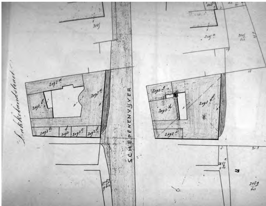
Afb. 2. Links: toestand stokerij en omringende huizen voor de brouwerij er bij kwam eind 1844. Rechts: toestand stokerij-brouwerij en de drie overblijvende huizen na 1844, maar voor 1849. Uiterst rechts: een deel van de door de Stad verkochte loten op de vroegere Schepenenvijver (AKG, Gent Sectie D, mutatieschetsen, 1848 nr. 17).

Op 22 augustus 1846 keurde de gemeenteraad het betreffende plan van stadsarchitect Louis Roelandt goed. Het gaf in essentie de loop aan van het ondergrondse met aanduiding van de percelen stadsgrond die zouden verkocht worden na het dempen van de Schepenenvijver en de nieuw aan te leggen straat. Hiervoor verwijzen we naar het artikel over de Schepenenvijverstraat in Ghendtsche Tydinghen 2016 nr. 4/5. Op 2 september volgde de goedkeuring