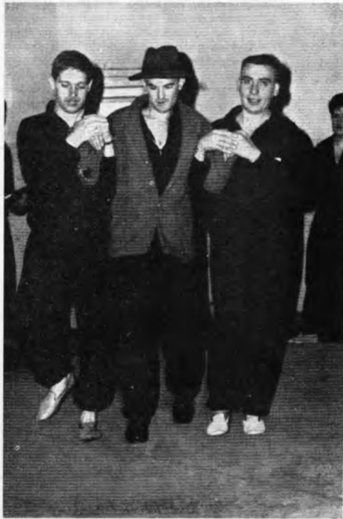
Opleidingsgreep bij zelfverdediging.

Afb. 3. Ook dat hoort bij de opleiding: een 'schurk' (broertje van Flurk?) wordt door bereidwillige medeleerlingen in de greep gehouden (herkomst: zie afb. 2).