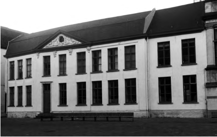
Afb. 4. De ex 'Permerence' (Permanentie) aan de Poeljemarkt in iets betere toestand dan destijds (foto 2016).

da d'ander dien carbonén é. IJ hielt da tége de lucht en oaster genoeg goatses in woare kreegde 'n nieuw, die g' achter da't oat gebruikt, moest wigsteke veur d'andere. Want oas ge nie op èuwen kie vive woard, woard et kwijt en woast 't velleke schampavie. Ge kost toens wére terte bij nen inspecteur zoender eu velleke.