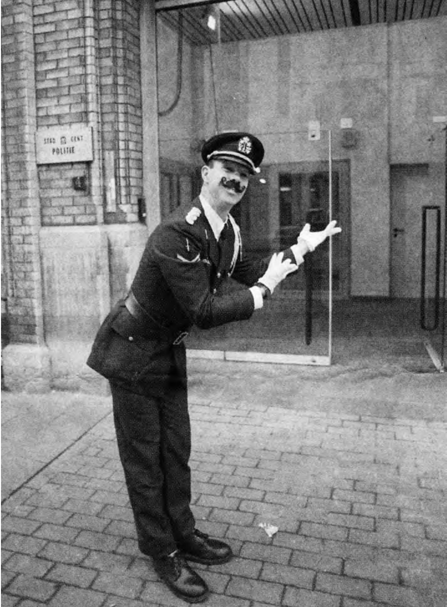
Afb. 6. Nen azent met pantomimetalent demonstreert het nieuwe onthaal in de Belfortstraat (knipsel uit Het Volk , 3 feb. 1997, coll. DSMG).