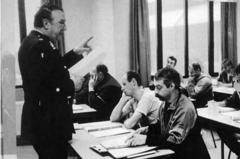
Afb. 1. Aandachtige (?) leerlingen in de politieschool (1997, Greet Polfliet, fotoreportage Blauw in zwart - wit).