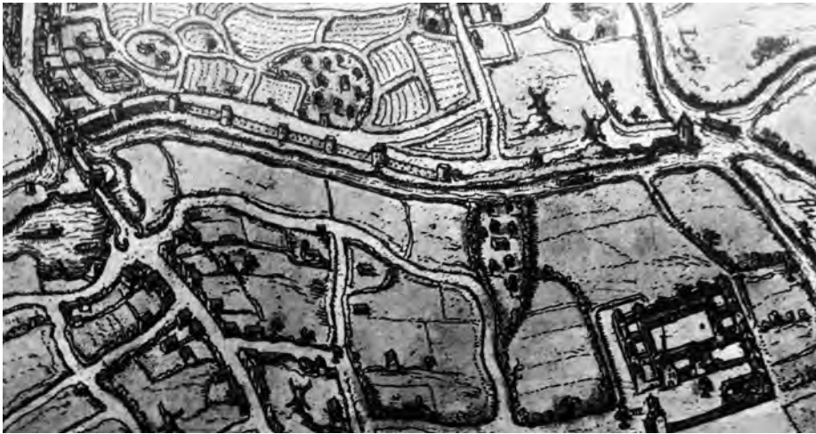
Afb. 1. In tegenstelling tot jongere stadsplassen van Gent toont het plan van Braun en Hogenberg (1575) nog de stadsmuur tussen de Waalpoort en Einde Were op de voorgrond. Naast een windmolen op een molenberg zijn er negen torens te onderscheiden, waarvan enkel de toren bij Einde Were voorzien is van een spits. Buiten de stadsomwalling lag toen nog het Chartreuzenklooster te Rooigem. Rechts van het plan zien we de kronkelende Leie stromen in de meersen, die in de winter een watervlakte vormden. Detail van kaart (SAG AG L1/7 Gandavum).

Bij Ekkerghem echter ziet de stadsversterking er enigszins anders uit: het was een kilometer lange stenen muur met torens. Je kan dat zien op het bekende schilderij 'Gent in 1534' in het STAM, waar die vest helemaal op de achtergrond zit: goed kijken! In de periode 1414 -1454 werd tussen de Brugsepoort (destijds Waalpoort genoemd) en Einde Were de vermoedelijk aarden wal ver-