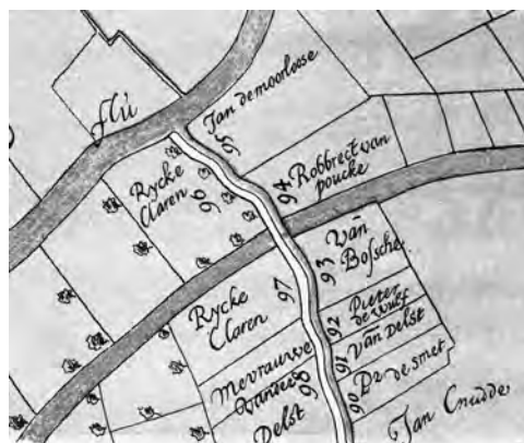
Afb. 3. Detail uit de 'schilderskaart' van Gent door Jacques Horenbault (1619) nagetekend door Armand Heins (1900). Hier het verlengde van de Schoonmeersbeek aan de noordzijde van het huidige spoorterrain bij de Leie (aangeduid als Flu: afkorting van fluvius, stroom). De weg is de huidige Snekkaai. De namen zijn deze van de eigenaars van de grondpercelen aan beide zijden van de grensgracht.