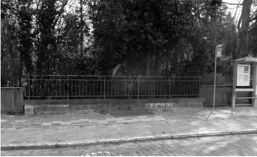
Afb. 5. Lange tijd was de brugleuning aan de Sint-Denijslaan de enige voor het publiek gemakkelijk zichtbare getuige van de grensgracht (foto 2013).