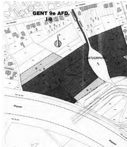
Afb. 7. Detail van een onteigeningsplan voor de verbindingsweg van het Sint-Pietersstation met de R4 en bijhorende natuurcompensatie. Die is hier weergegeven als donkergekeurde zone met middenin de nieuw aan te leggen Schoonmeersvijver, verbonden met de Sint-Denijslaan door de oude Rietgracht die hier niet Maaltebeek genoemd wordt, zoals op het plannetje aangeduid staat, maar Schoonmeersbeek (met dank aan Mw. van den Bogaerde).