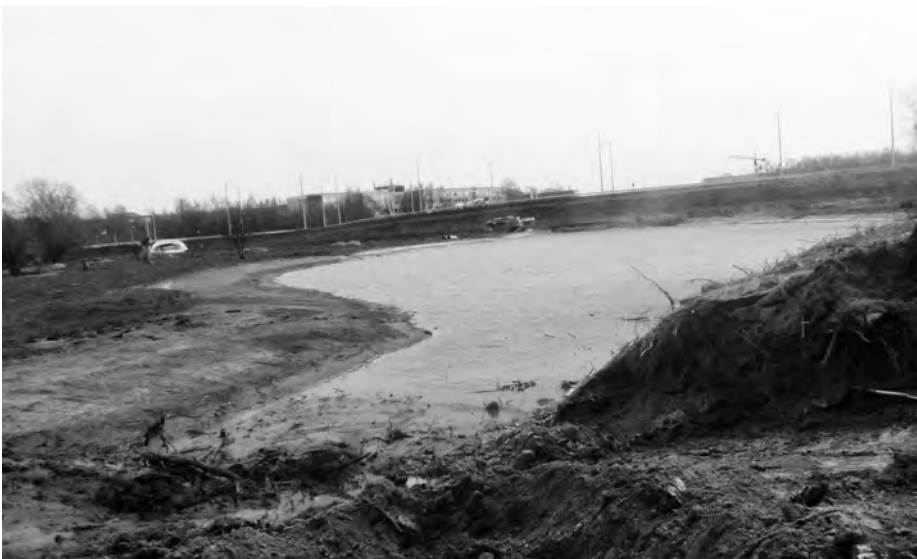
Afb. 8. Foto genomen in 2013 van de nog niet lang tevoren aangelegde Schoonmeersvijver aan de door de Ringvaart afgeknipte beek. In tegenstelling tot de Schoonmeersbeek is dit niet historisch. Het is een 'compensatienuurgebiedje' tussen zware verkeersinfrastructuur.