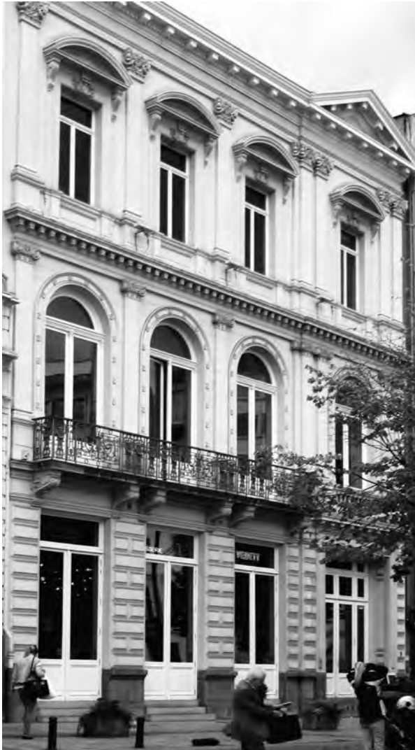
Afb. 2. De voorgevel die de handelaarvereniging l'Union in 1874 liet optrekken op de Kouter. Vermoedelijk was het een verbouwing van de linkervleugel van het Hôtel de la Poste (afb. 1). Thans onderdeel van de Handelsbeurs (foto 2015).

keizerlijke edict van 1786 dat alle kermissen in het hele land op dezelfde dag wilde doen inrichten. Noch min nog meer! Er werden geen woorden verspild aan die maatregel, hij werd simpelweg genegeerd. De Franse revolutionairen probeerden eveneens iets dergelijks met het inrichten van een nieuw feest, 'une fête républicaine', met onder andere (Frans)-patriottische manifestaties en plechtige uitreikingen van prijzen aan verdienstelijke leerlingen en burgers