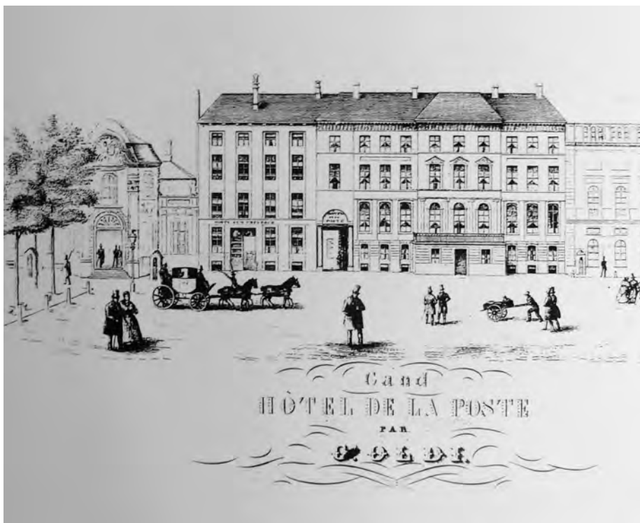
Afb. 1. Hoewel we niet weten of de petitiemakers van l'Union precies daar vergaderden, is het Hotel de la Poste op de Kouter naast de Hoofdwacht min of meer te beschouwen als de wieg van de Gentse Feesten (porceleinkaart, verzameling DSMG Sint-Amandsberg). In 1849, nauwelijks enkele jaren na haar stichting (1842), verwierf de vereniging een deel van dit gebouw om er in 1851 haar feestzaal in te richten.

Daarin schrijft hij: Hoogtepunt in de wijken was de jaarlijkse parochiekermis: acht kermissen in Gent, die gemiddeld negen dagen duurden! Onder druk van de ondernemers, die met veel te veel werkverlet geconfronteerd werden, bepaalde het Stadsbestuur in 1779 dat er voortaan maar één kermis zou zijn in de stad, de Sint-Baafskermis van de tweede tot de derde zondag van juli, daarmee vooruitlopend op de algemene maatregel van de 'keizer-koster Jozef II.