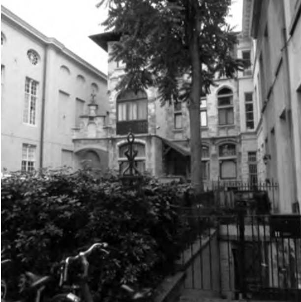
Afb. 2. Foto genomen in 2015. Op de plaats van de gedempte Houtlei ligt nu een privé toegang tot een begin twintigste - eeuwse 'villa'. Rechts vooraan een bewaard gebleven gedeelte van de ijzeren afsluiting weergegeven op afb. 3.

historische hart van de stad (zie kadertekst en kaartje). Voordat de straat de naam Appelbrugstraat kreeg, stond ze bekend als 'den Zeertzak' (rue des Tricheurs). Tussen de Appelbrug en de Burgstraat, buiten dit centrum, was de naam Breydelsteghe of Breidelstraat gangbaar (2). Breydel of breidel doelde oorspronkelijk op de activiteiten van makers van paardentuig die naast breidels, teugels en ander paardentuig ook zadels vervaardigden. Dat zien we weer spiegeld in de Franse benaming rue des Selliers.