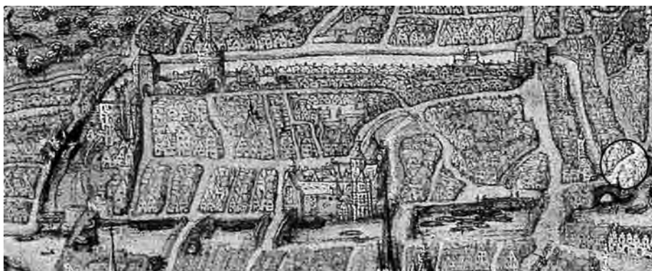
Afb. 1. Detail van de kaart uit 1534 (STAM Gent) waarop de Jan Breydelstraat is omcirkeld. Hierop zien we ook de Appelbrug en de Houtlei die de straat in twee snijdt.

Vandaag kennen wij de Jan Breydelstraat, het nauwe straatje tussen de Drabstraat en de Burgstraat, als één straat. Dit is ze echter niet altijd zo geweest. Eeuwenlang bestond dit tracé immers uit twee delen die verschillende namen droegen. Tot 1898 werd deze straat namelijk in twee gedeeld door de Houtlei. Dit kanaal, vermoedelijk gegraven in de 12de eeuw, mondde ter hoogte van het huidige Designmuseum uit in de Lieve. Beide delen werden met elkaar verbonden door de Appelbrug. De naamgeving van deze brug verwijst naar 'De Gulden Appel', een befaamde herberg die op de plaats stond van het latere Hotel de Coninck, het huidige Designmuseum. De naam 'Houtlei' dateert uit de 16de eeuw en verwijst naar de functie die het kanaal had om hout per schip te vervoeren en het hout te stapelen en te verhandelen langs de kade. Voordien sprak men over de 'Gracht', wanneer nodig met een nadere plaatsbepaling zoals 'bij Poortakker', of 'bij de Posteernepoort' (1).