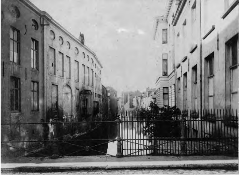
Ab. 3. Zicht op Houtlei vanaf de vroegere Appelbrug. Het linkse gebouw is vandaag het Designmuseum, gebouwd als Hôtel de Coninck in 1755. Bemerkt de muurankers in de zijgevel.