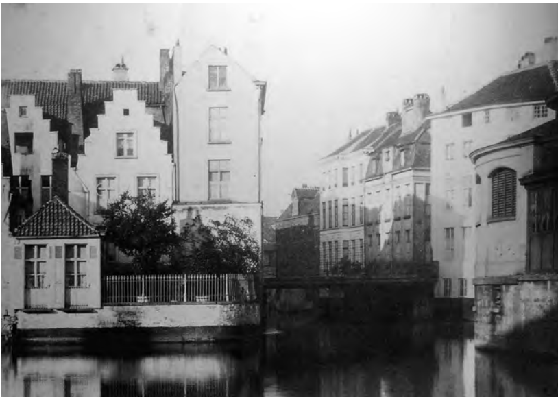
Afb. 4. Zicht op de Appelbrug (SAG, SCMS 4347).