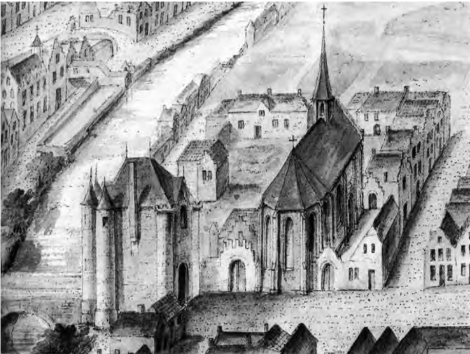
Afb. 1. Het wolweverscomplex en de Walpoort (bij de Ketelvaart, linksonder) in de zestiende eeuw. Godshuisgebouwen en kapel gesitueerd rond een binnenplein tussen de vaart, de Kouter (boven), de Kleinveleeshuissteeg (rechts) en de Kortedagsteeg (onder).

De Wolweverskapel aan de Kortedagsteeg, toegewijd aan de H. Leonard, maakte deel uit van een godshuiscomplex voor de erediensten en armenzorg van de nering van de wolwevers (lakenwevers) (afb. 1). In die tijd was dat veruit het grootste en machtigste ambacht. Samen met de 'kleine neringen' en het patriciaat vormden de wevers de drie leden van het laat-middeleeuwse stadsbestuur. Vandaar de bouw in de jaren 1300 van een eigen, vrij grote