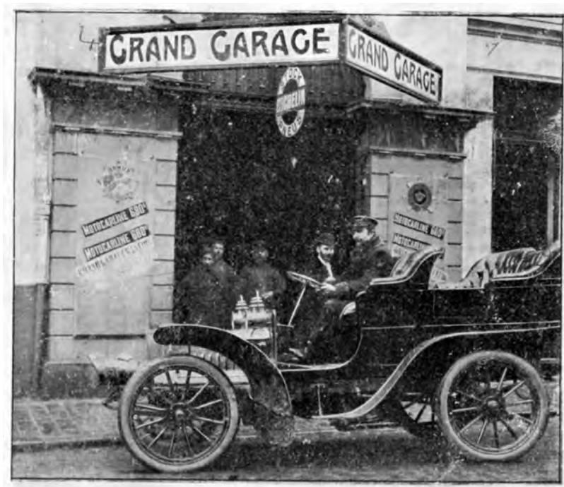
Afb. 6 Stoere automobilist of chauffeur aan de ingang van Grand Garage, Kortedagsteeg (ongedateerd, periode 1905 - 1912,).

Aan de noordzijde van de kapel hoorde oorspronkelijk een gangetje bij het complex. Op de afbeelding 1 is een poortje aan de straat en een poortgebouwtje binnenin te zien. Daar gaf de steeg toegang tot het al vermelde binnenplein