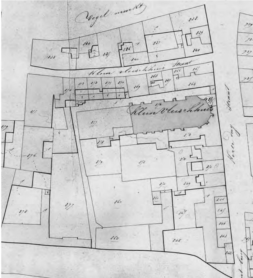
Afb. 8. Detail uit het eerste kadasterplan van Gent (ca. 1830, UGent bibliotheek). De gang aan de noordzijde (boven) van de kapel (hier aangeduid naar de toenmalige functie van Klein Vleeshuis) is verbonden met een nauwe steeg (links) die uitgaat op de Ketelvaart. Daar rond en daarbinnen is de site van het godshuis nog herkenbaar. Enkel de noordwand van de kapel is nog vrijstaand, maar deze muur is enkel door een gang afgescheiden van de bebouwing aan de Kleinvleeshuissteeg. De zeventiende-eeuwse achterbouw van de kapel is nog intact.

werd dat onderdeel van een nieuwe verbinding tussen het Zuidstation en het westen van de stad met de verbrede Brabantdam en de Zonnestraat, en verderop met nieuw aangelegde straten aan de overzijde van de Leie tot voorbij de Coupure.