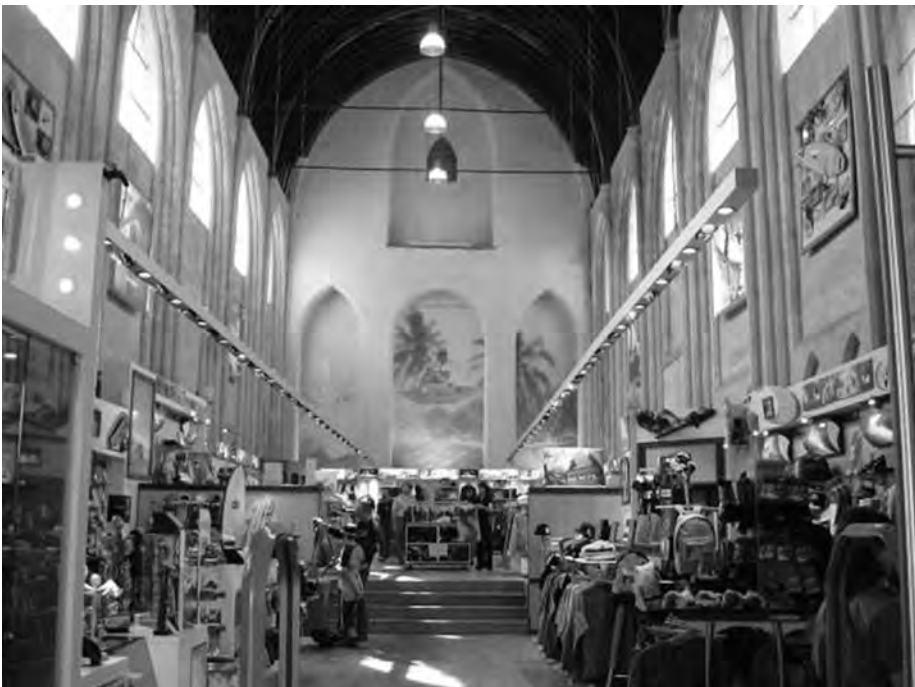
Afb. 10. Binnenzicht (2015) van de Wolveverskapel in gebruik als kledingmagazijn.