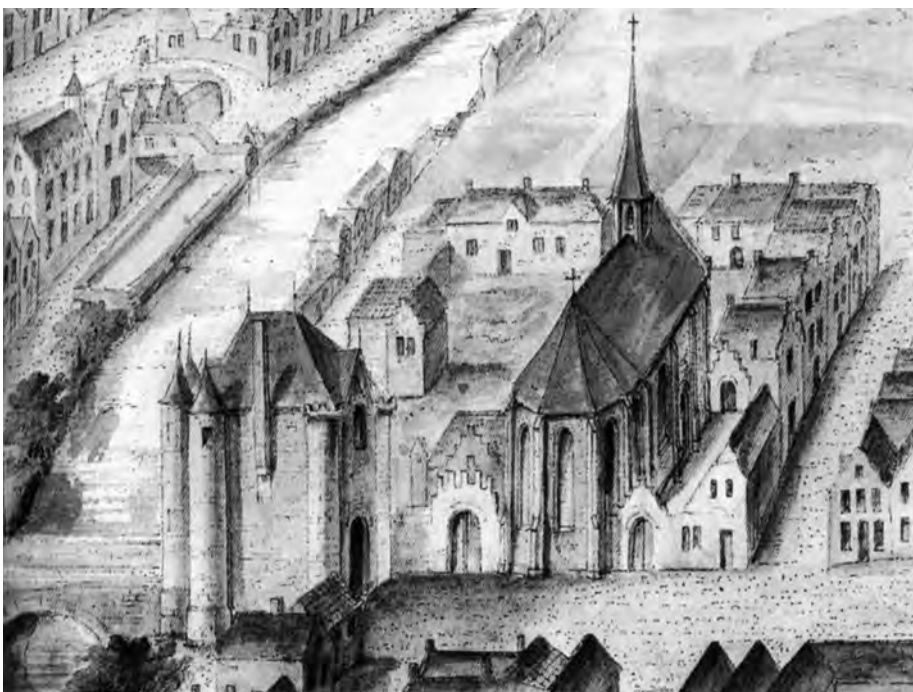
Afb. 1. Het wolweverscomplex en de Walpoort (bij de Ketelvaart, linksonder) in de zestienste eeuw. Godshuisgebouwen en kapel gesitueerd rond een binnenplein tussen de vaart, de Kouter (boven), de Kleinveleeshuissteeg (rechts) en de Kortedagsteeg (onder).

De Wolweverskapel aan de Kortedagsteeg, toegewijd aan de H. Leonard, maakte deel uit van een godshuiscomplex voor de erediensten en armenzorg van de nering van de wolwevers (lakenwevers) (afb. 1). In die tijd was dat veruit het grootste en machtigste ambacht. Samen met de 'kleine neringen' en het patriciaat vormden de wevers de drie leden van het laat-middeleeuwse stadsbestuur. Vandaar de bouw in de jaren 1300 van een eigen, vrij grote