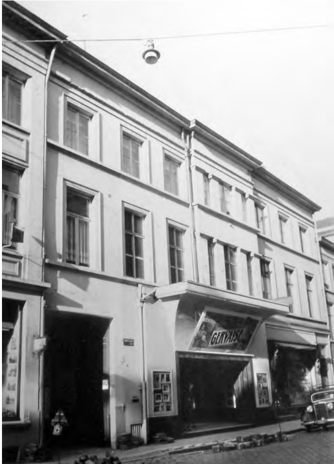
Afb. 9. Foto uit de jaren dat cinema Savoy er vertoningen gaf. De ingang is opgenomen in de eenheidsbebouwing aan de straat, maar - zoals het hoort bij een cinema - voorzien van een 'moderne' luifel.

kapel als monument beschermd. Bij de meest recente restauratie onder leiding van architect Ro Berteloot werd aan de Kortedagsteeg een kleine min of meer open ingang geschapen die de vroegere toestand (met enige fantasie) evoceert, en de eenheidsbebouwing aan de straat toch respecteert. Het zwaar aangetaste dak werd grondig gerestaureerd en de bundelpijlers tegen de binnenzijde van de muren hersteld. Restanten van vroegere verbouwingen werden verwijderd. De uit 1910 daterende neogotische sjabloonbeschilderingen aan de binnenzijde werden verwijderd. Die waren aangebracht bij de inrichting als zaal