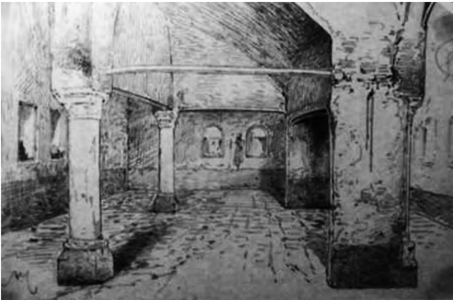
Afb. 2. De zeventiende-eeuwse keuken achter de kapel zoals Armand Heins die nog zag en schetste.

De kapel en de achterliggende ruimte tot aan de Kouter en de Ketelvaart werd in 2007 bouwhistorisch verkend en grondig archeologisch onderzocht. Een dendrochronologische datering (ouderdomsbepaling aan de hand van de jaarringen) bevestigde de veertiende-eeuwse origine van de kapel (bomen gehakt tussen 1292 en 1320). Achter de nog bestaande bebouwing werden, naast tal van sporen uit de tijd van de kapelbouw, resten aangetroffen die wijzen op een ‘steen’ uit de jaren 1200, ouder dus dan de kapel. In dezelfde ruimte werd een