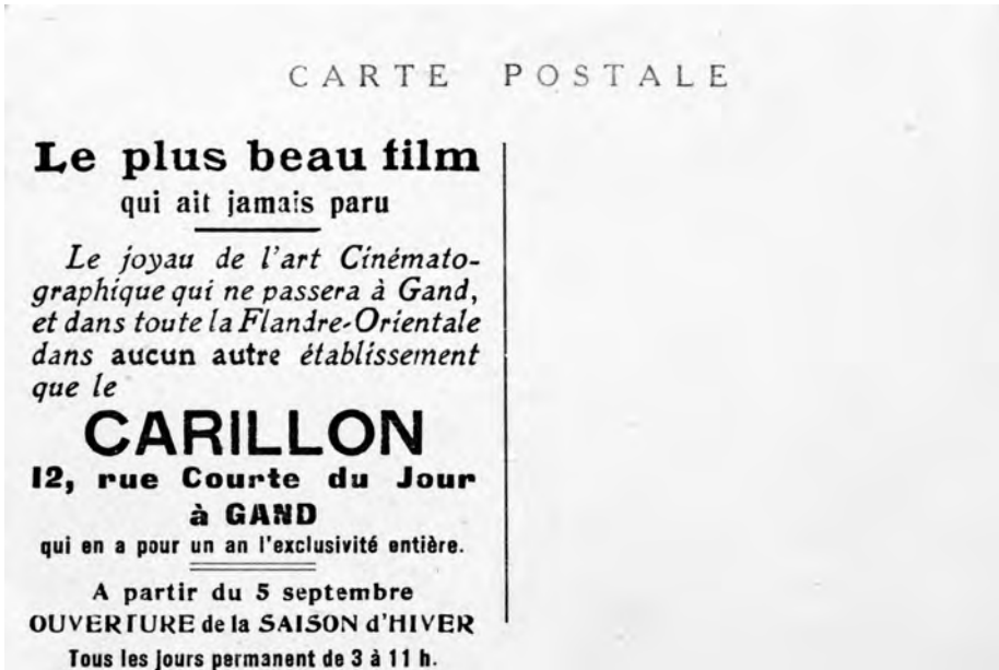
Afb. 7. Ongedateerde postkaart uit de tijd dat in de zaal Le Carillon films gedraaid werden (verzameling PKRH).

en wellicht ook met de Ketelvaart en de Kouter. Later werd dat achterin vernauwd tot een steegvormige toegang tot de Ketelvaart (afb. 8).