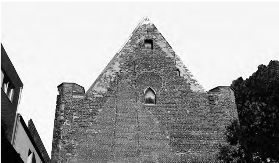
Afb. 3. Top van de westgevel met aanzet van twee flankertorentjes en sporen van verbouwingen (foto 2015).

De kapel met steil zadeldak heeft negen traveeën (muuronderverdelingen). Die worden van elkaar gescheiden door steunberen en bevatten meestal een al of niet dicht dichtgemetseld hoog spitsboogvenster. De twee hoeken van de westzijde (naar de Kouter) zijn voorzien van een achthoekige flankertorentje (afb. 3). In 1879 werden in het koor vroeg-15de-eeuwse muurschilderingen onder kalklagen ontdekt, die vandaag echter niet zichtbaar zijn (afb. 4). Cal-