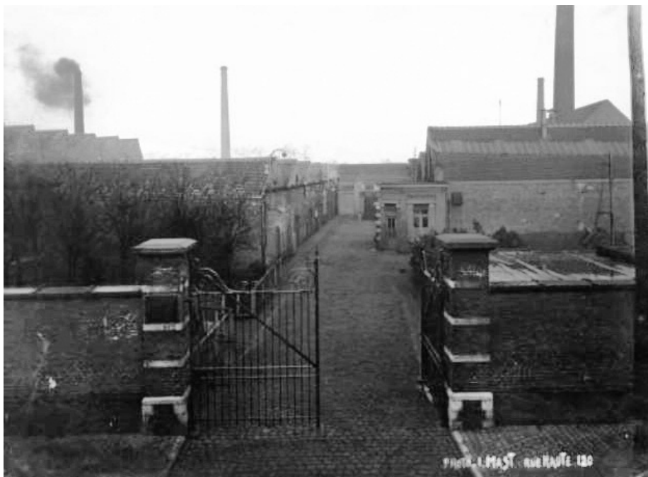
Afb. 4. Tissage de Gendbrugge’ destijds aan de Kerkstraat.

Na de vrede van Brest-Litovsk (3 maart 1918) tussen Duitsland en Rusland werden alle krijgsgevangenen aan het Oostfront uitgewisseld. Na 11 november, Wapenstilstand, werden Russische soldaten wel zo snel mogelijk naar