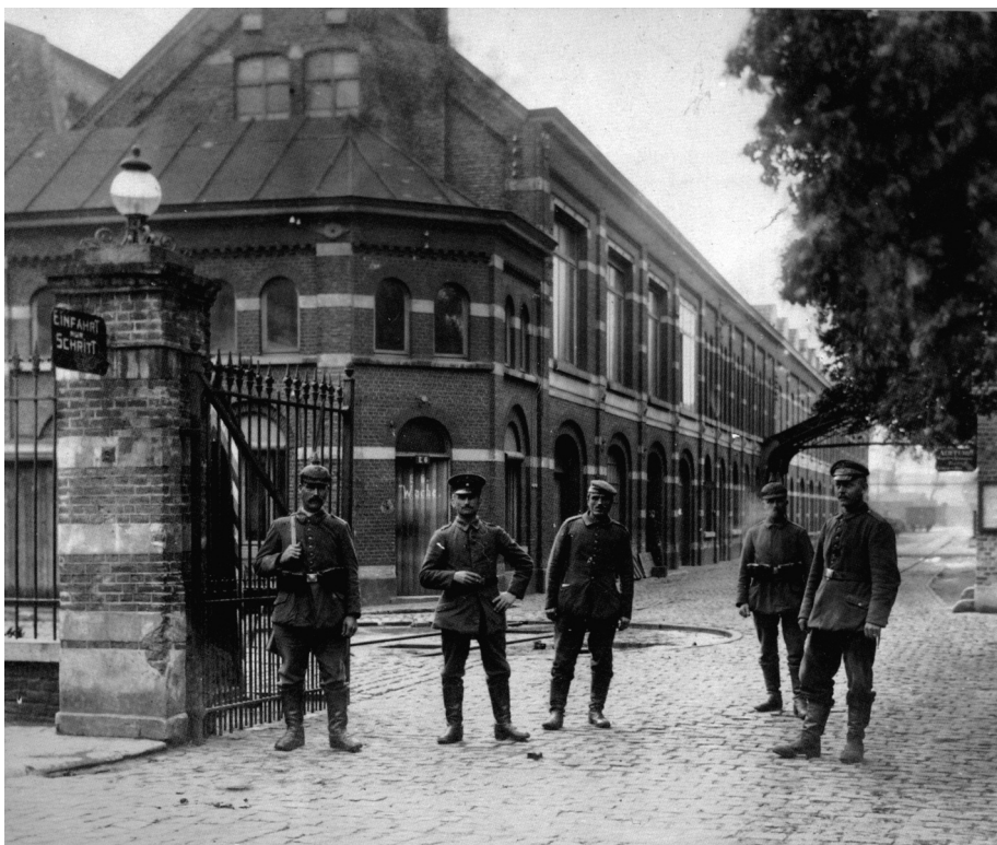
Afb. 3. Clouterie et Tréfilerie des Flandres in Gentbrugge (foto verzameling D. Pieters), Fabriekswachters van het 'Landsturm Infanterie Batalion Gent'.

Volgens de registers van de Westerbegraafplaats overleden de meeste Russen waarschijnlijk ten gevolge van de Spaanse Griep in het Militair Hospitaal, twee onder hen in het 'Weezenhuis' aan de Martelaarslaan en één in St-Peter (de kazerne in de Sint-Pietersabdij). Het betreft krijgsgevangenen die, zoals Marc Baertsoen schrijft (hier in vertaling) door de Duitsers tewerkgesteld waren in de 'Clouterie des Flandres' (Puntfabriek) van Gentbrugge of elders in onze agglomeratie, er ziek geworden zijn en gestorven zo ver van hun ge-