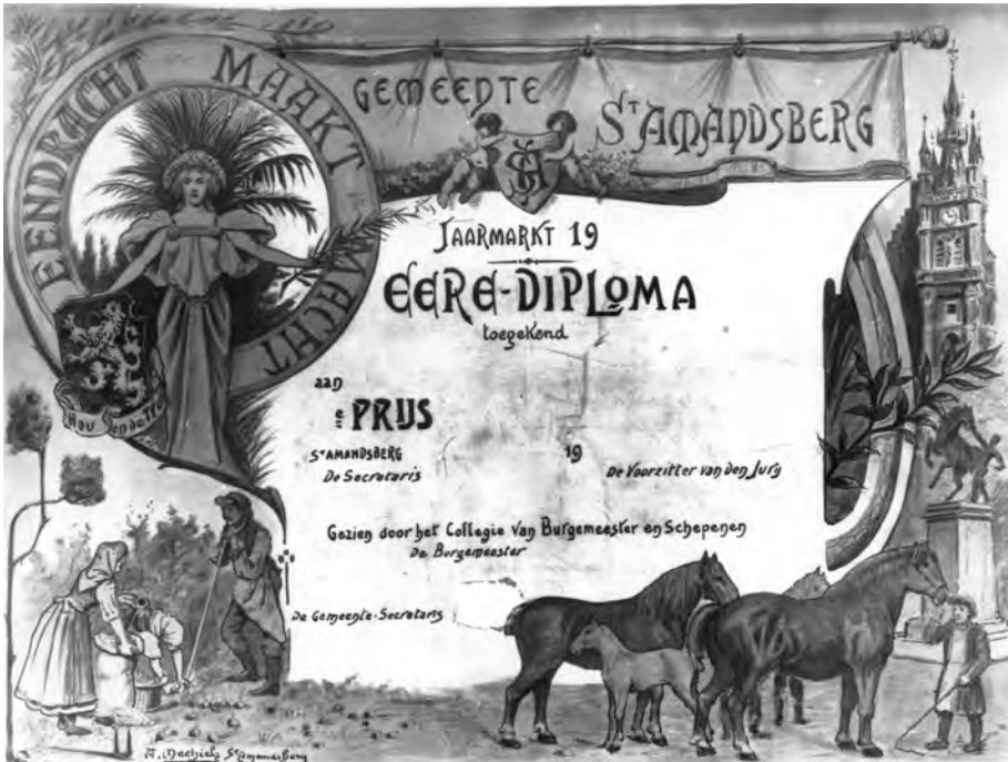
Afb. 4. Fotoafdruk van een 'Eere diploma' (vermoedelijk omstreeks WO I, DSMG). Deze Jaarmarkt van Sint-Baafs is de oudste onafgebroken doorlevende Gentse traditie. In de negentiende en eerste helft van de vorige eeuw was het overwegend een paardenmarkt.

Zuu alle joare kwam ter op Ledebirg, zuu een klein cirkske. 'k Zatte planton oop den bureau oas ter doar ne mensch binne kwam. Der was t'snachs ne pony van zijne cirk gestole. Allee, begin 't er moar an. In dienen tijt woas ter noog gien sproake van chips in ilder uure oof 'k weet' nie woar. Allee meniere, wad' est, nen engst, een merre, wa kleur, oe èwt, ède ne fottoo? Wulder moesten in dienen tijt nie lang' en verre zoeke, oas oenzen tamtam roend