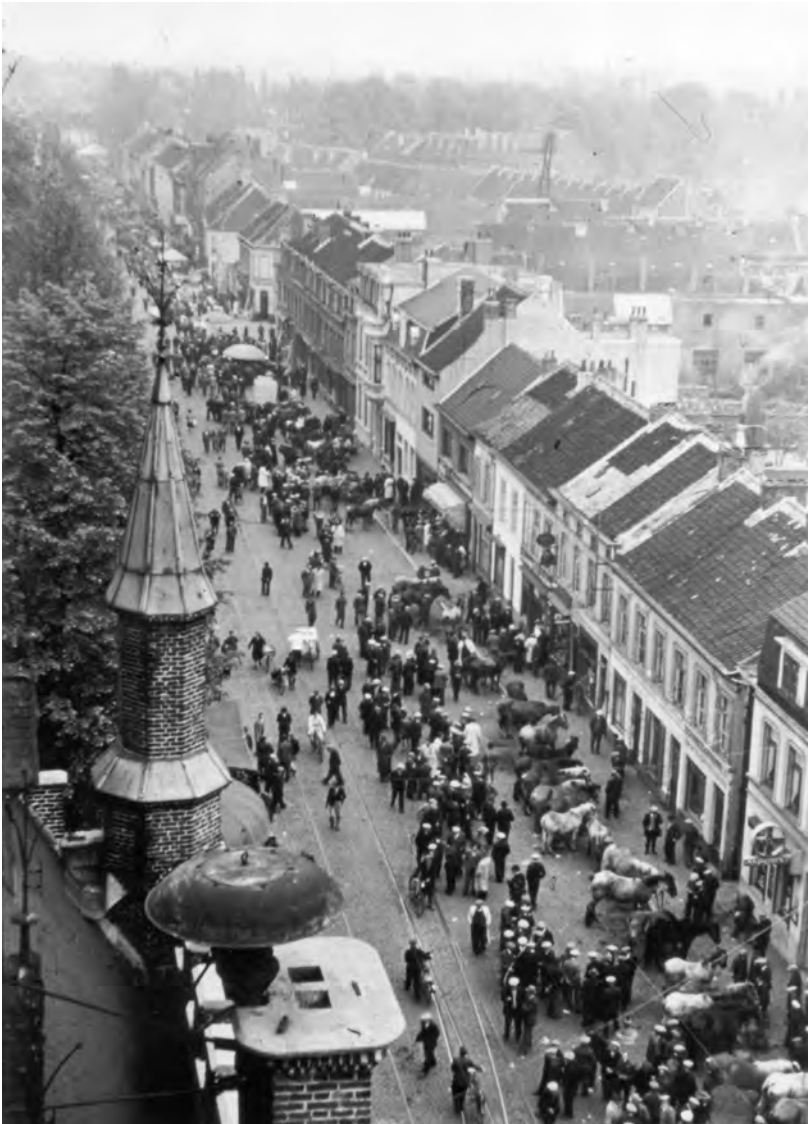
Afb. 5. Indrukwekkende reeks paarden opgesteld langsheen de Antwerpsesteenweg (1951, foto genomen vanaf de 'transen' van het gemeentehuis). De glorie tijd van het 'boerenpaard', het Belgisch Trekpaard en van de Negenmeimarkt zou weldra naar zijn einde lopen.

't Woas nog in den tijt da de zendurms peizedegen da zulder den boas woare! Allé via de centrale riepe ze mij op veure noar Melestée te rijje omda 't er ien