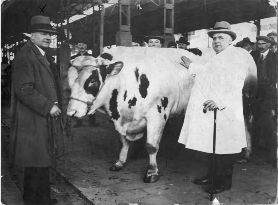
Afb. 2. Prijskamp 'Den Vetten Os' onder de metalen luifels (afgebroken in 1991) van de Nieuwe Beestenmarkt (ongedateerde foto in DSMG).

de Kastielloane mé den Heirnislaan. 't Woas op 't uure van de noene. Al da verkier stont stille, en moar troempe. Wulder zuu goe oof da we koste zuu roend da bieste geluue. Oop ne moment, kwam ter ne combi toe, staptgede doar nen azent uit, den diene paktegede zijnen pistool: "Ién scheute"! Lappe, da bieste plets oop de keie! Zu duud oof een luize. Echt woar. Mee ien scheute.