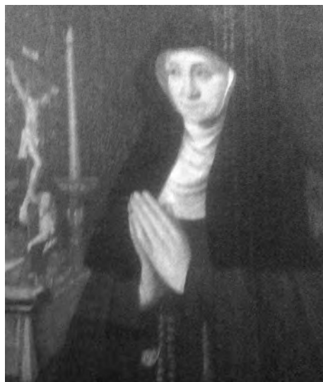
Afb. 5. Schilderij met Madeleine de Trazegnies in kloosterhabijt (Sint-Jozefskapel van de 's Heiligs Kerstskerk, Gent, foto 2017).