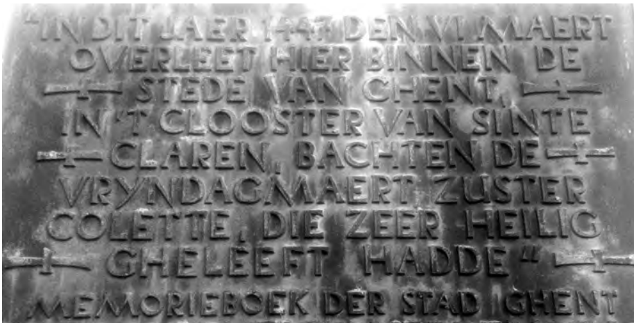
Afb. 3. Gedenkplaat aan de straatgevel van tot grote woning omgebouwde kapel van het Colettinenklooster gesticht door de heilige Coleta van Corbie in de Gentse Goudstraat (foto 2017, detail)

voedsel voor de kluisnares leggen. Naast deze cel de bidplaats. Hier heeft men in de kerkmuur, met het uitzicht op het koor, een opening gekapt, waarin een kruisvormige ijzeren tralie is gemetseld. Een schuifdeurke laat haar toe het vensterke te sluiten, en het te openen om haar biecht te spreken, de heilige communie te ontvangen en de diensten bij te wonen'. Ze draagt een ruw-harig kleed. 'Drie kettingen snijden rond haar lenden in het weke vlees'. 'Wanneer slaap en vermoeienis haar overvallen, tracht Coleta rust te vinden op het bed vol takken en wortels. Het hoofd ligt op een houten blok'. Zo blijft de jonge vrouw vier jaar lang in Corbie tot ze naar de paus geroepen wordt en begint te reizen om vrouwenkloosters levend volgens de regel van de heilige Clara (klarissen) te hervormen en te stichten, onder meer in Gent.