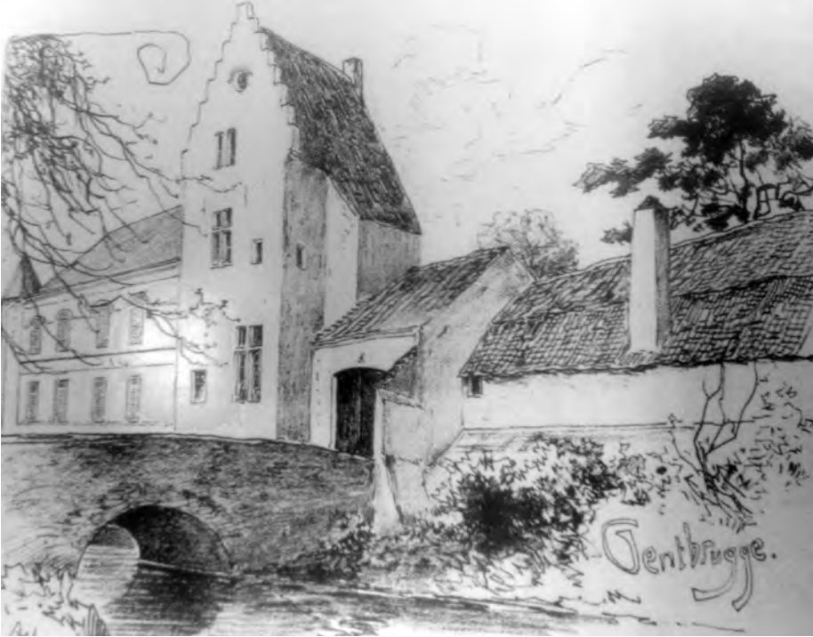
Afb. 4. Kasteel 'Oude Kluize' van Gentbrugge aan het begin van de vorige eeuw in de typische stijl van Armand Heins. Er was een kluis aangebouwd bij de kapel van dit 'speelgoed' (maison de plaisance).

baar leefde daar toen een groepje van die lieden en waren die niet echt wat we verstaan onder kluizenaars. Ze werden zelfs 'broeders heremijten' genoemd, eigenlijk een contradictorische term. Sommigen hielden school, anderen gingen zieken dienen.