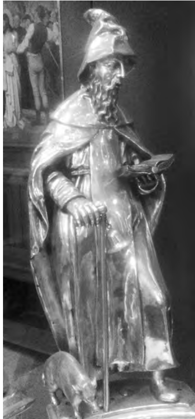
Afb. 1. Sint-Antonius eremijt. Detail uit een reliekschrijn in de Seleskestkerk (Sint-Salvator), Sleepstraat Gent (foto 2017).

den, leefden de meeste Gentse kluizenaars midden in de stad, dichtbij een klooster of kerk, in een huisje op een kerkhof, bijvoorbeeld. De term kluis, waarvan hun benaming afgeleid is, betekent afgesloten (Latijn clausus , Frans clos ) en dat mag je letterlijk nemen.