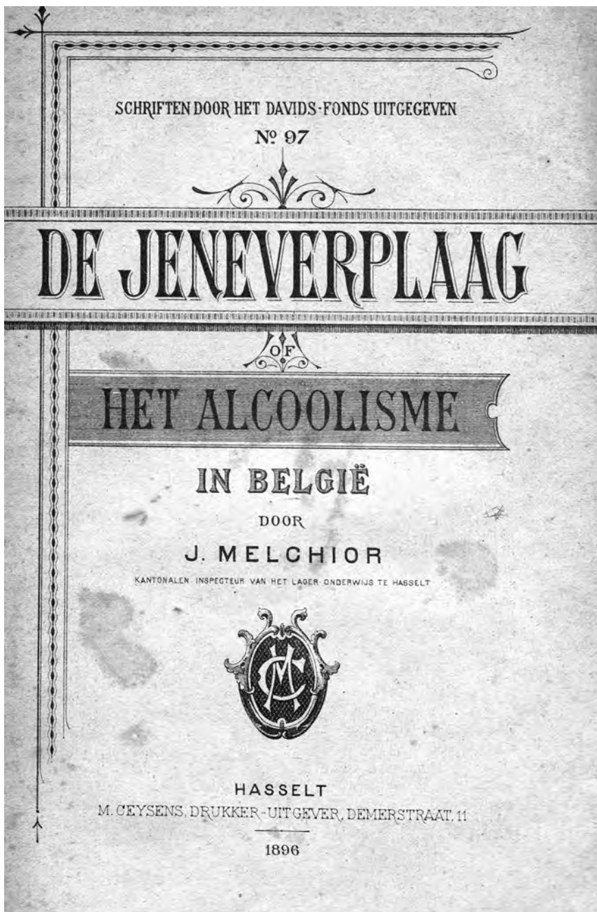
Afb. 5. Schutblad van Melchior, J. (1896). De jenerplaaag. Het alcoholisme in België. Hasselt, Davidsfonds (bewaard in DSMG, zie afb. 2).