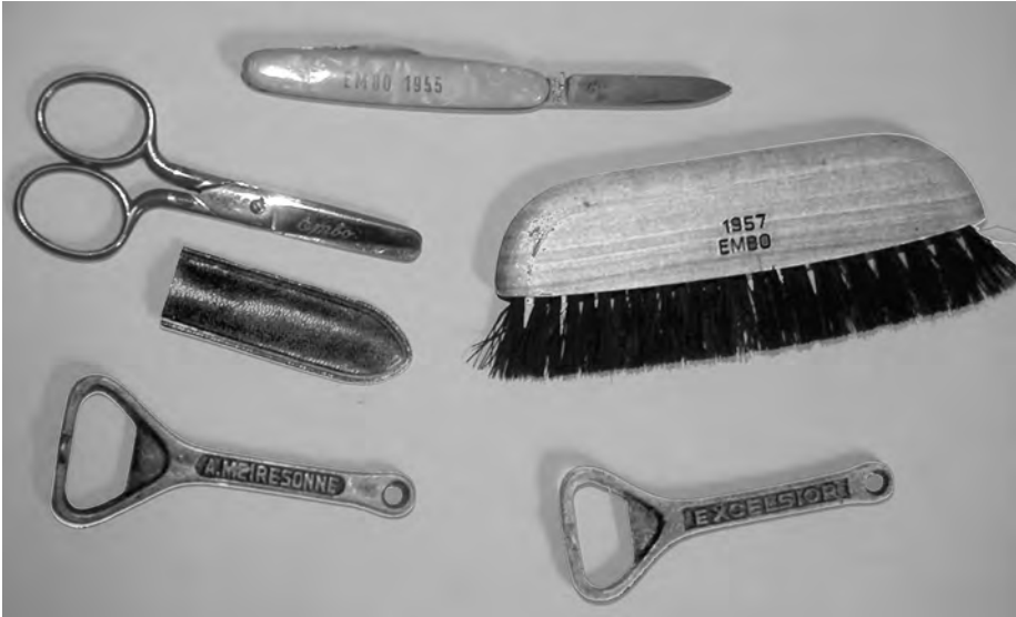
Afb. 6. Nieuwjaarscadeautjes van de Gentse zuivelfirma Embo en biersleutels van de brouwerij Meiresonne (verzameling Ödberg).