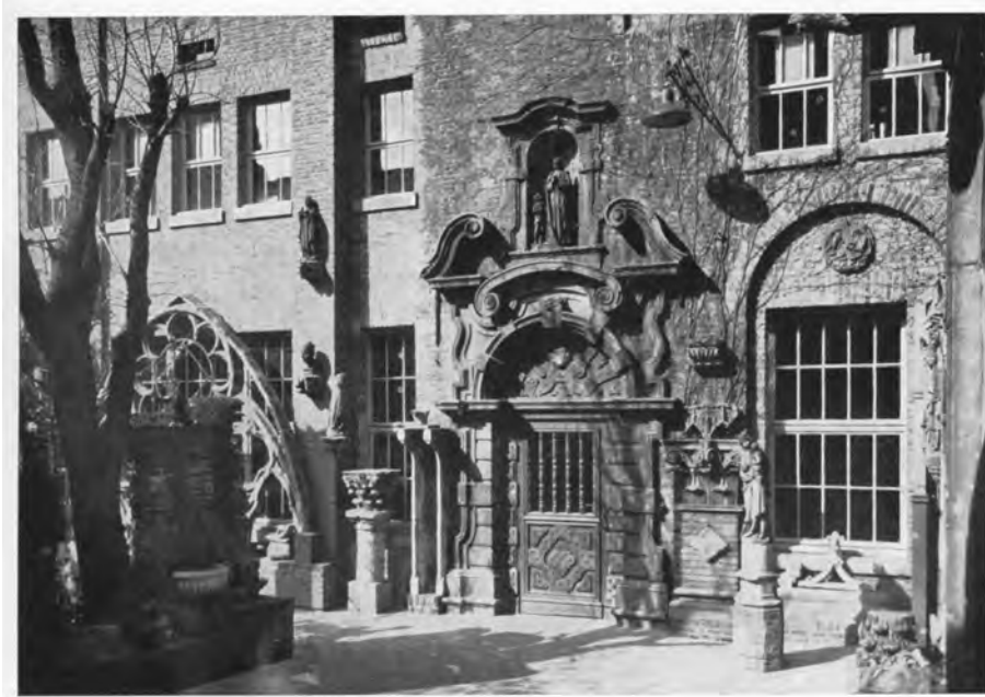
Afb. 2. Actuele foto van het Alexianenpoortje, anno 2018 nog steeds in de museumtuin (foto A. Coene – M. De Raedt, met bijzondere dank).

de parochie van de ‘Schieve Tore’. Die toren is er van 1509. Er wordt, nu nog verteld dat de bouwer eraf sprong toen hij zag dat hij niet gans recht stond. Deze wanhoopsdaad zullen wij voor rekening van de legende laten. Het overhellen zal wel later gekomen zijn, ingevolge de zuidwestenwind en het uitdrogen van het gebinte van de spitse naald.’