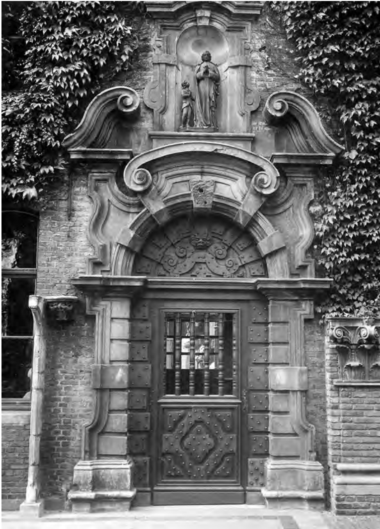
Afb. 1. Het tweede Alexianenpoortje, destijds in de Watergraafstraat, maar in 1944 in de museumtuin van Sint-Lucas.

mers. Boven de ingang bleef het tegelpaneel centraal in de gevel gemetseld. Na de Tweede Wereldoorlog werd het beheer van Oud Gend overgenomen door de grote bioscoopketen Cinex en kreeg de cinema de naam Century. Zeer waarschijnlijk werd toen de verouderde benaming Oud Gend op de onderste twee rijen van het tegelpaneel overschilderd, het gelijkvloerse verdiep werd toen mede gemoderniseerd-vermassacreerd.