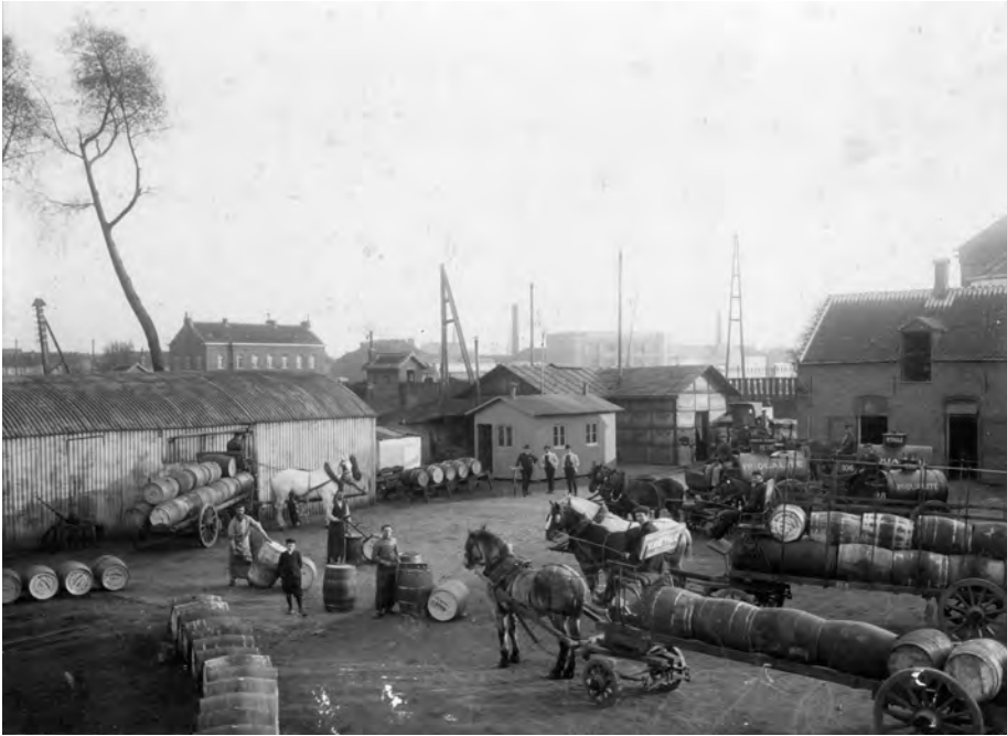
Afb. 4. Bedrijvigheid op de petroleumopslagplaats aan de Wolterslaan. In de achtergrond het grote huis van de sluismeesters van het Heirnis sas (Gentbrugge sas). In die tijd was dat nog een drukke sluis op de Nederschelde, nu een immer gesloten stuw van het 'roldeurtype'.