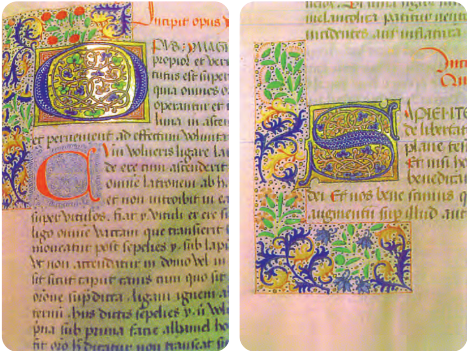
Afb. 5. Twee details uit een handschrift (2de helft 15de eeuw) gemaakt in opdracht van de jonge abt de Mercatel in het atelier van Willem Vrelant te Brugge. Enkele karakteristieken van dit atelier zijn goed te zien: gehistorieerde initialen, één tekstkolom, vruchten en acanthusbladen in blauw en goud op een onbeschilderde achtergrond van perkament. Universiteitsbibliotheek Gent, hs. 2.

Deze grote (afzet)mogelijkheden voor kunstenaars lokten vanaf de vijftiende eeuw ook verluchters uit het buitenland. Zo belandde de uit Utrecht afkomstige Willem Vrelant in 1454 in Brugge, waar hij de boekverluchting nieuw leven inblies. Na zijn aankomst in de Zwinstad stichtte hij het ‘boekverluchters- en librariërgild’ met Sint-Jan als patroonheilige. Nagenoeg alle kunstenaars en ambachtslui die iets met het boekbedrijf te maken hadden, sloten er zich bij aan. Van in het begin deed Mercatel voor de verluchting van zijn handschriften een beroep op Vrelant. Zijn topatelier was in de jaren 1460-1480 bijzonder actief in Brugge. Zelfs enkele jaren na het overlijden van de meester (1481?) liet de abt in diens atelier nog een bundel astrologische traktaten verluchten. (32)