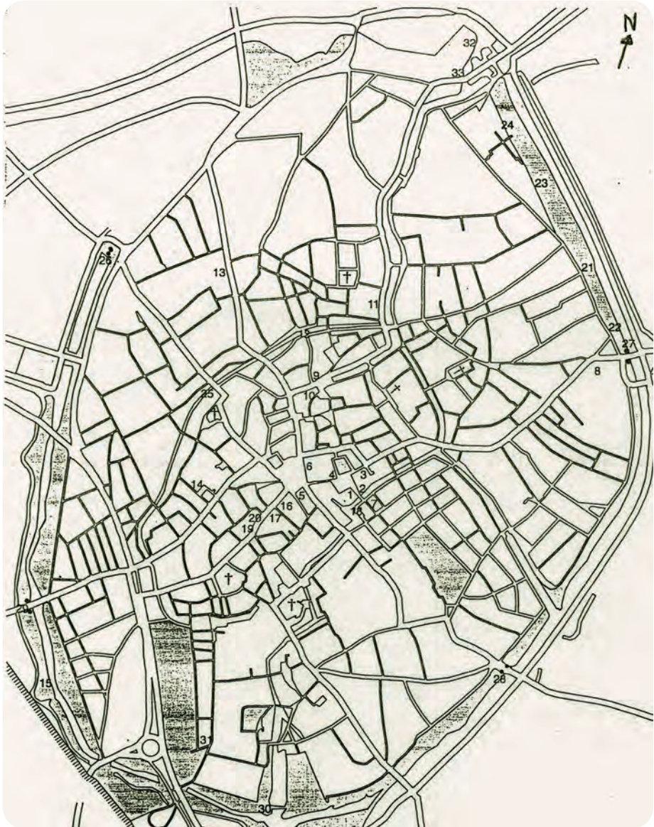
Afb. 4. Plattegrond van Brugge in de late middeleeuwen (uit Geirnaert en Vandamme, 1996). Links onder (nr. 29): de nog bestaande Smedenpoort. Op nr. 14: het Prinsenhof, de grafelijke residentie in de stad, die aanzienlijk werd verfraaid tijdens de late Bourgondische periode. Het huidige gebouwencomplex is hoofdzakelijk van latere datum. Iets zuidelijker lag het stadshuis van de Gentse Sint-Pietersabdij en dat van de gelijknamige abdij van Oudenburg. Vlakbij (zie +) ook de Sint-Salvatorkerk, nu kathedraal.