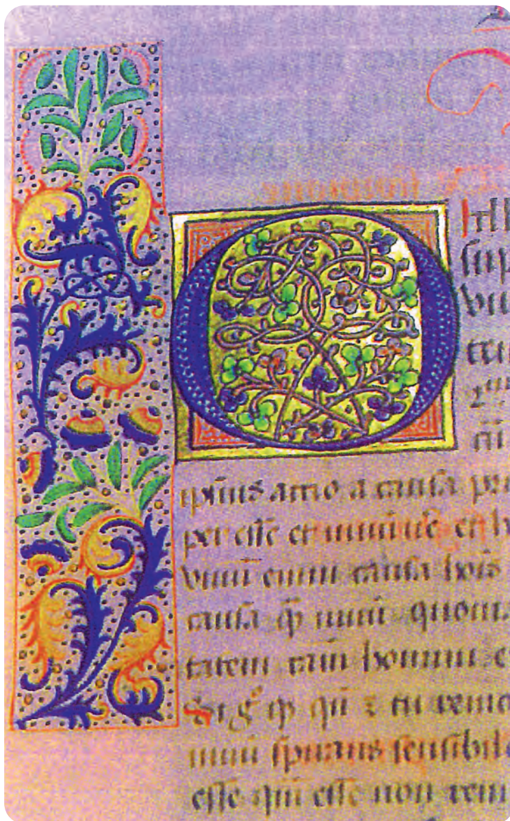
Afb. 1. Een detail uit een van de zes 'Oudenburgse' handschriften van Mercatel. Sober schrift op een heldere bladspiegel van één kolom. Let op de gepunte liggende streepjes om een afkorting aan te duiden en op de speciale esse-afkorting op de derde laatste regel. Randversiering met bloemen, vruchten en acanthusbladeren op onbeschilderde perkamentachtergrond.

Het tekstfragment begint met een gehistorieerde initiaal.