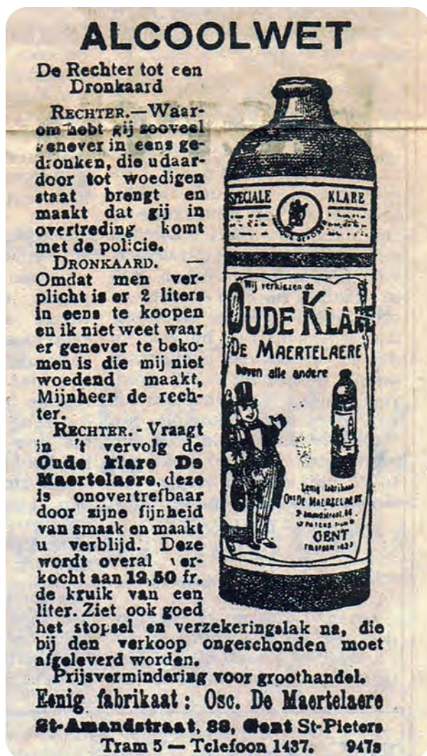
Afb. 1. Een dronkaard verklaart voor de rechter waarom hij zoveel jenever drinkt die hem 'in woedende staat brengt'. De rechter raadt hem aan voortaan Oude Klare De Maertelaere te drinken: 'deze is onovertreffbaar door zijne fijnheid van smaak en maakt u verblijd' (overdruk uit De Gentenaar, 1921).

Verzameld in het Documentatiecentrum DSMG door HANS DOUSSELAERE