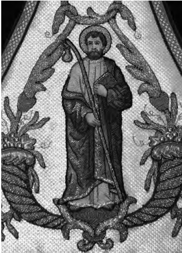
Afb. 4. De H.Jacobus de Meerdere geborduurd op een stola uit de eerste helft van de twintigste eeuw.