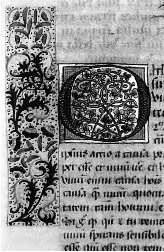
Afb. 1. Detail uit één van de 'Oudenburgse' handschriften van abt Rafaël de Mercatel. Sober schrift op een duidelijke bladspiegel van één kolom. Gepunte liggende streepjes om een afkorting aan te duiden; speciale esse-afkorting op de derde laatste regel. Toegeschreven aan het Brugse atelier van Willem Vrelant (UGent bibliotheek, hs. 2).

door humanisten als Erasmus. In 1522 stelde de pauselijke nuntius onder de Brugse benedictijnen zelfs een 'te grote sympathie' voor de 'prins der humanisten' vast.