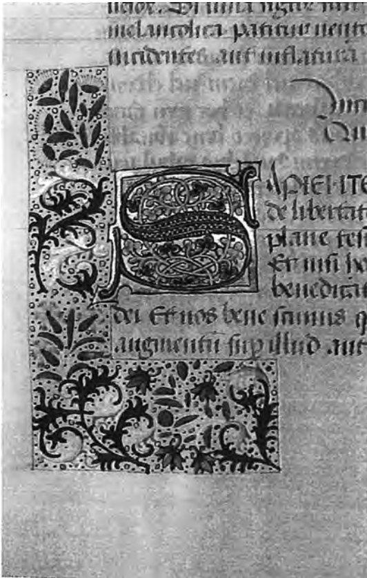
Afb. 2. Detail uit een handschrift (tweede helft vijftiende eeuw) gemaakt in Brugge in opdracht van de jonge abt Rafaël de Mercatel. Enkele karakteristieken van het atelier van Willem Vrelant en van de humanistische stijl zijn goed te zien: gehistorieerde initiaal, één tekstkolom, sober handschrift, randversiering op onbeschilderde perkamentachtergrond.

Voor de verluchting van zijn handschriften deed De Mercatel toen een beroep op het atelier van de uit Utrecht afkomstige Willem Vrelant in Brugge, de geboortestad van de abt. Diens atelier in de Zwinstad was in de jaren 1460-1470 bijzonder actief. Het produceerde zowel religieuze, bijvoorbeeld getijdenboeken, als wereldlijke handschriften voor bibliofielen. De verluchting kenmerkt zich door gehistorieerde initialen, verfijnde kleine en bladvullende miniaturen en een randversiering met bloemen, vruchten, acanthusbladeren en grotesken op onbeschilderde perkamentachtergrond (zie afb. 2).