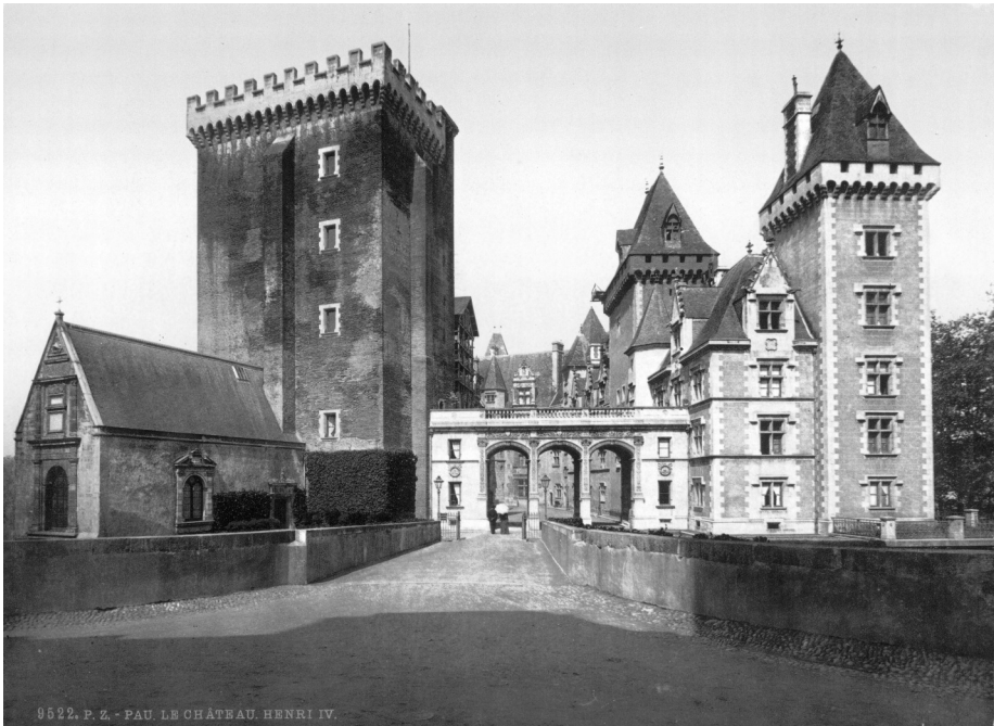
Afb. 4. Het kasteel van Pau.

Kunsten Edward Anseele om de polyptiek naar Amerika te sturen werd niet ingevolg. Ook het idee om het kunstwerk onder te brengen in de kluizen van de Nationale Bank of de Kredietbank vond geen genade, evenmin het idee het op te bergen in de crypte onder Sint-Baafs. Die was immers gereserveerd om als schuilplaats voor 500 personen te dienen. Toen kwam prof. Hulin de Loo met het voorstel op de proppen om het Lam Gods in veiligheid te brengen in het Vaticaan te Rome. Op 8 februari 1940 liet het Vaticaan aan Bisschop Coppieters weten daarmee in te stemmen.