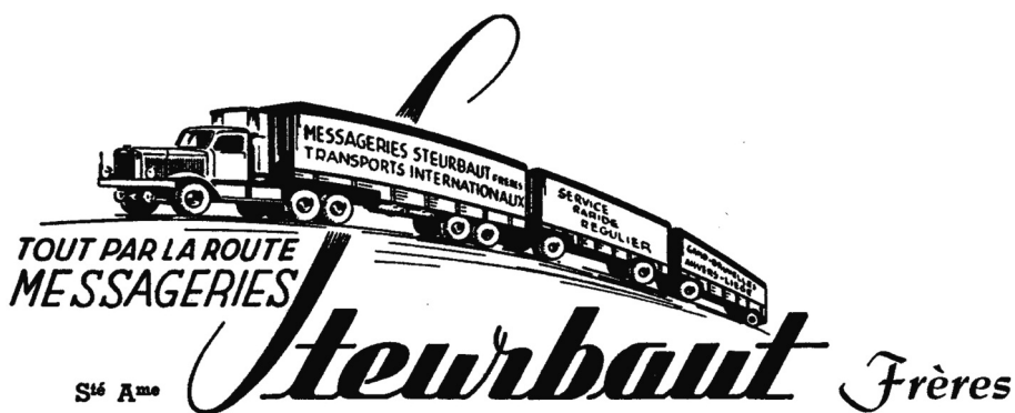
Afb. 2. Publiciteit uit het Interbellum.