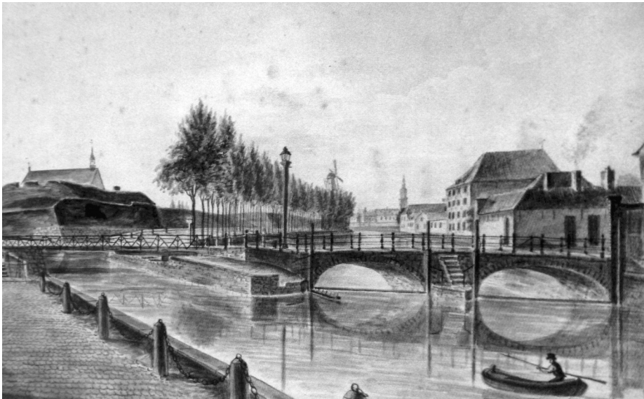
Afb. 5. Het uitzicht van het Groot Pas in 1752 gecreëerd met het graven van het Visserijkanaal (detail uit Wynantz, ca. 1820, De Zwarte Doos). Een draaibrug (links) over dit kanaal verleent de schepen toegang tot de Visserijsluis en de Nederschelde aan de Keizerpoort. Dit gebeurde via een tot onderdeel van het Visserijkanaal omgevormde vestgracht van het Spaans Kasteel waarvan de wallen links nog zichtbaar zijn. Het gedeelte Nederschelde binnen de laat-14de-eeuwse stadsvesten is samen met de Reep (feitelijk een deel van de Nederschelde) afgesloten van de scheepvaart door twee vaste stuwen onder het vaste gedeelte van de Pasbrug. In de verte het torentje van Nieuwenbosch.

duidelijkste herkenningspunt, kwam toen in gebruik. Na de afbraak van de toren op bevel van Karel V en vooral na een grote ombouw in 1752 werd dit het Groot Pas: de stuw werd verlengd met een draaibrug over het toen gegraven Visserijkanaal (afb. 5). Indien deze stuw al niet de grootste was in Gent, dan was ze voor de scheepvaart zonder meer de belangrijkste. De constructie werd toen meestal aangeduid als Passtuw en de brug in het verlengde daarvan over het toen nieuw gegraven Visserijkanaal werd nu de Pasbrug. De benaming ‘pas’ kwam hier dus pas laat op de proppen, veel later dan bij de kleine constructie middenin het Nieuwpoortje.