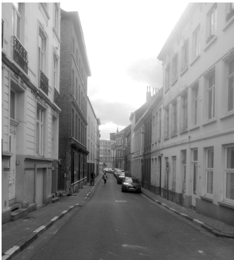
Afb. 1. Tussen 't Pas gezien vanuit de Sint-Joriskaai (foto 2017)

Tussen 't Pas, een stemmig straatje in de wijk Nieuwpoort (afb. 1 en 2) met een toch wel raar klinkende naam. Bij 'tussen' verwacht je immers een ruimte, of wat dan ook, tussen twee dingen of begrippen. Maar neen: hier enkel 't Pas', alsof er maar één was. In dit artikeltje zien we dat de naam heel logisch ontstond toen er daar twee 'passen' waren. Hoe zat dat in elkaar?