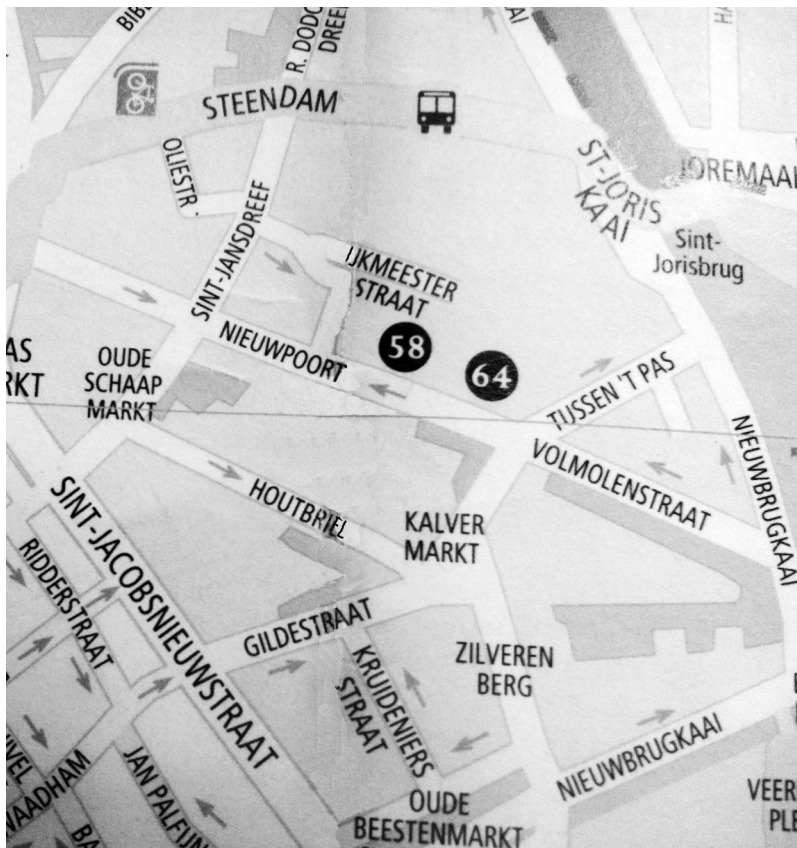
Afb.2. Detail uit een actueel stratenplan.

Het woord ‘pas’ komt wel meer voor in Nederlandse plaatsnamen (1). Het betekent ofwel een met kaphout beplante waterzieke zone, afgeleid van het Latijnse pascuum, ofwel een doorgang, van het even Latijnse passus. In het middeleeuwse Gent, met zijn vele waterzieke zones en vooral vanwege water moeilijke doorgangen, was er echter slechts één pas te vinden. Maurits Gyseling neemt voor het Gentse Pas de tweede betekenis aan en hij identificeerde de vroege vermeldingen ‘an de Passebrugge’ (1325) als slaande op een brugje over de Sint-Jansgracht (2), onderdeel van de zogenaamde Binnenste Oude Leie (afb. 3 en 4). Dit werd later Kombrug genoemd (3). Mocht de brug nog bestaan, zou je erover passeren als je van de Kalvermarkt naar de Schelde toe stapt, meer bepaald ter hoogte van de kruising met de Volmolenstraat. Die straat werd deels op de gedempte Sint-Jansgracht aangelegd.