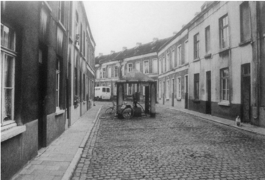
Afb. 5. Een gedeelte van het steegbeluik Cité Anglaise of Oud kerkhof met opvallende gemeenschappelijke pomp midden op 'straat'. Die werd beschouwd als binnenplaats en was geen stadseigendom (foto genomen in 1981, verzameling Roger Moreau, gereproduceerd in Archiefbeelden Gent, deel VI, 2005, p. 118).

Die welstand en zijn impulsief gedrag bleken ook uit zijn koopgedrag in die jaren. Voorjaar 1875 koopt hij twee huizen in amper één maand tijd: het huis van een paardenkoopman en dat van een wagenmaker, allebei in Ledeberg. In beide gevallen betaalt hij in klinkende munt. Een jaar later koopt hij daar vlakbij, achter de Ledebergse Botermarkt, de vroegere Sint-Danneelskapel met bijbehorend erf, het al lang verlaten kerkhof van die kapel, voorloper van de huidige kerk. Normaliter mocht op een dergelijk terrein gedurende vijf jaar niet gebouwd worden. De verkoper had echter verkregen dat hiervan kon afgeweken worden. Indien er menselijke resten gevonden werden, moesten ze naar een bestaand kerkhof overgebracht worden. Sies liet er een groot steegbeluik, de Cité Anglaise, bouwen met 37 woninkjes op 22 are (afb. 5 en 6). Dit typeert de man als iemand die overal geld wist uit te slaan. Maar dat lukte blijkbaar toch niet altijd even vlot, want tijdens een transactie met vier 'defiti-