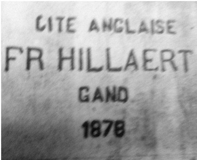
Afb. 6. Gevelsteen destijds bij de ingang van de Ledebergse cité.

ge' personen werd Sies beroofd voor 2000 frank, in die tijd een enorm kapitaal. Hij inde en betaalde alles contant, ook dergelijke hoge sommen. Altijd had hij baar geld in huis, opgeborgen in zijn twee (!) brandkasten.