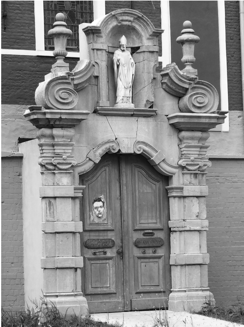
Afb. 2. De constructie in afb. 1. verschilt van een andere veel beter gekende poortomlijsting van de Alexianen, lange tijd ingang van het Sint-Amanscollege aan de Sint-Michielsstraat (zie Verbeke, A., 1982, Het Gent van toen , Van de Wiele, Brugge, p. 43). Deze verhuisde na heel wat herrie in verband met de ‘muur van de schande’ naar de Oude Houtlei en belandde vandaar op zijn huidige locatie achter de Alexianenkapel op de binnenkoer van de residentie Colleghof, vrij toegankelijk vanuit de Sint-Michielsstraat (foto 2017). Was dit ongeveer de oorspronkelijke plaats van deze tweede poorttoegang, toegankelijk via het verdwenen Schokkebroersvestje? Die stond zeker hoger, bovenop de vest, rest van de stadsomwalling aan de Houtlei. Het beeld van Sint-Amand is in elk geval niet oorspronkelijk: het dateert uit de collegetijd. In hoeverre de poortomlijsting zelf nog originele stukken bevat, weten we niet.