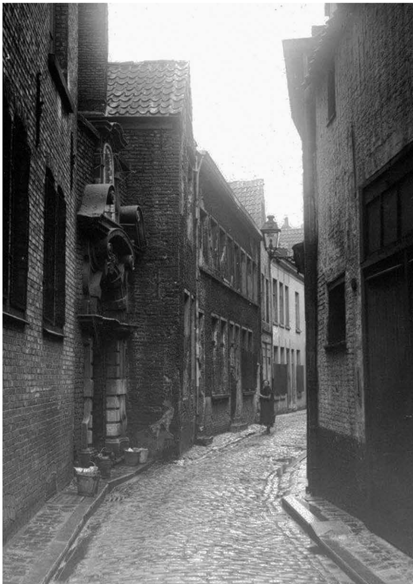
Afb. 1. De Watergraafstraat in de jaren 1940 met barokke poort, een van de monumentale toegangen tot het Alexianenklooster. Is dit de portiek bewaard in de museumtuin van Sint-Lucas zoals beschreven in Bouwen door de eeuwen heen , deel Gent 4na, p. 471?

termen verraden, waren de graven juridisch gezien slechts beheerders van het vorstelijk domein. De verre ‘eigenaars’ daarvan konden hun aanspraken echter slechts zelden waarmaken.