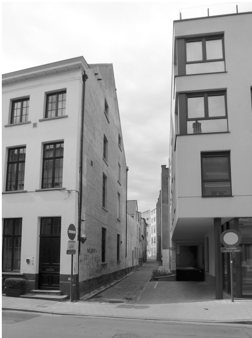
Afb. 3. De Watergraafstraat gezien vanuit de Sint-Michielsstraat. Rechts het RVT Collegehof – Residentie Watergraaf die de betonnen bunker van de school gelukkig verving. De hoge bebouwing in de achtergrond hoort bij de Sint-Lucasacademie. Of hoe massieve bouwvolumes steegjes, schandelijk verwaarloosd Gents erfgoed, kapot maken. Aan welke hoek het huis stond dat de watergraaf in 1358 kocht, weten we helaas niet.

De praktische regeling van dat recht op ‘zijn’ domein liet de Vlaamse graaf over aan een ondergeschikte. Wellicht omdat het grootste gedeelte van de door deze ambtenaar gecontroleerde gebieden in het waterrijke Vlaanderen recht-