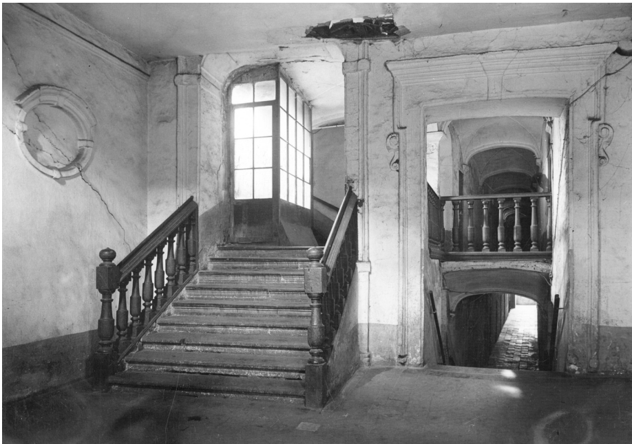
Afb. 1. Traphal in het gewezen domonikanenklooster Onderbergen.

Pogingen om meer te weten te komen over Ritsaert leverden tot op heden niets op. In het Amsab zitten ook foto's van hem uit het interbellum van Gentse socialistische voormannen, maar daar wist men niets over die fotograaf. Misschien een goede vraag voor de GT lezers?