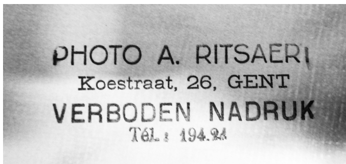
Afb. 2. Keerzijde van de foto in afb. 1.