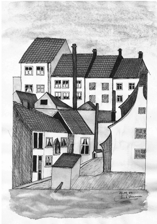
Afb. 4. Een (te) fraai beeld uit 1989 van de Veergrep toen dit waterstraatje nog een armtierige cité was (DSMG, Begijnhof Sint-Amandsberg, afd. Vliegende Bladen Gent, reeks straten).

Patrick Meershaege, die in de Kortrijksepoortstraat woont bij de Veergrep (vroeger een beluik, sinds een hele tijd al een parkje) schrijft. Aan de ingang van het park hing een muurkapel die vroeger een van de gevels in het beluik sierde (afb. 4). Bij de afbraak van de huisjes is deze kapel gerestaureerd door het bisdom Gent en in de jaren 80 opnieuw aan de gevel bevestigd van het ondertussen tot studentenpand omgevormde hoekhuis. Deze zomer is het studentenhuis volledig verbouwd en heeft men bij de buitenschilderwerken de kapel verwijderd. Dit is ondertussen al enkele maanden geleden maar de kapel is nog altijd niet teruggeplaatst. Ik heb dit gemeld aan de stadsdienst Monumen-