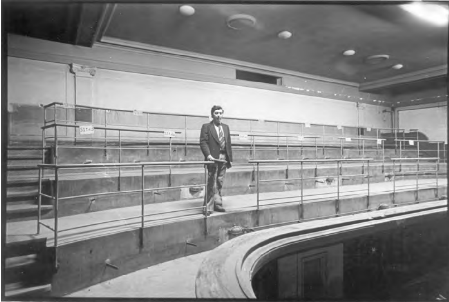
Afb. 3. Binnenzicht met staaatribunes.

van geslacht: het werd ‘den Ancien Belgiek’, kortweg ‘den Ancien’. Het theater overleefde de tweede oorlog en kende nog tot in het begin van de jaren zestig veel succes. De Gentse instelling was een typisch variététheater (afb. 4) waar ook een deel van het publiek aan tafeltjes zat en waar duchtig geconsumeerd werd, zoals in een café-théâtre.