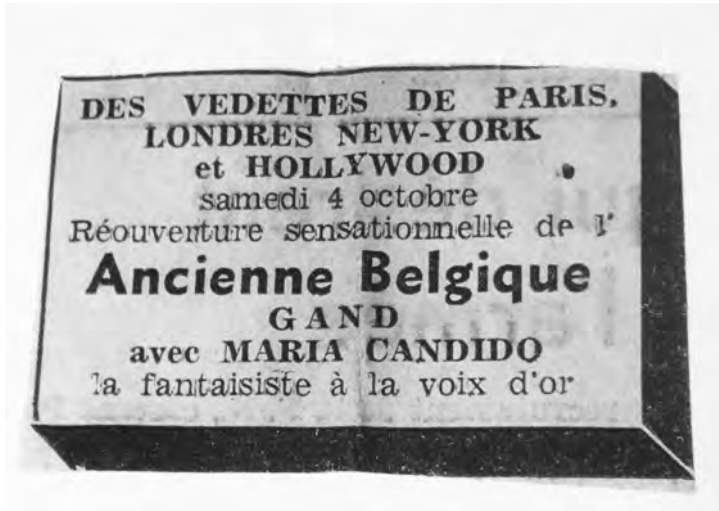
Afb. 11. Internationale ‘vedetten’ bij de vleet op de openingsvoorstelling van het seizoen 1958 (publiciteit in La Flandre libérale , DSMG).

Extraatjes buiten het seizoen vormen de Breugeliaanse namiddagen, feesten niet enkel van de goeie luim, maar ook van de goeie appetijt. Te savoueren vallen, naast de befaamde wafels van het huis, met suiker, boter, room en fruit, ook de ‘boerenvlaaien’. Om ieders smaak te gerieven zijn er de crème glacées met de meest aantrekkelijke smaken en vormen: vanille, mokka, karamel met aardbei of banaan en - O sole mio - de tranche sicilienne of napolitaine. L’embarras du choix, quoi. Uiteraard kan men er ook een apéro of warme drank bestellen. Als meneer erbij is, kan hij zich vergasten op een pils, een scotch of een frisse pale-ale. Voor de kinderen is er yoghurt, fruitsap, limonades... Dat alles in een kader dat niet enkel de fameuze tijd van Breugel evoceert, maar ook serene Hollandse weidsheid, grenzeloze Hongaarse poesta tot zelfs een vleugje Israël. Dat alles aan normale prijzen, gepresenteerd door het personeel gekleed in Vlaamse kermisstijl. Op maandagen en woensdagen zorgt Paul Rutger van de Belgische radio voor aangename deuntjes op Amerikaans orgel. Iedere woensdagnamiddag in de maand mei worden er modedéfilés verzorgd door ‘Tricot Nicole’. Op die manier hoopt directeur Piers een deel van zijn personeel buiten het seizoen werk te bezorgen.