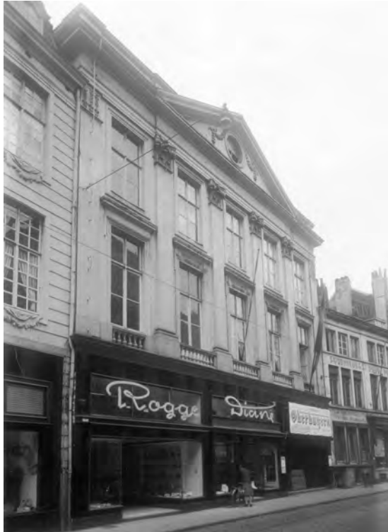
Afb. 2. De Ancienne Belgique in de Veldstraat, nu een warenhuis, hier met een gevelreclame voor een Oberbayernprogramma. Het theater was samen met ‘Diane’ en een vestiging van ‘Rogge’ ingericht in een mooie oude herenwoning, in oorsprong een of twee omgebouwde middeleeuwse ‘Stenen’, zoals te zien op afb. 1.

reldtentoonstellingen die omstreeks de eerste wereldoorlog in Brussel, Antwerpen en Gent gehouden werden. Het meest succesvolle onderdeel daarvan waren reconstructies in papier maché op raamwerk en kippengaas van wat moest doorgaan als oude steden: ‘Oud Gent’, enz. Onmisbaar daarin waren de dagelijkse variété shows. Met ‘oud’ hadden die weinig of niets te maken, met ‘Belgique’ evenmin.