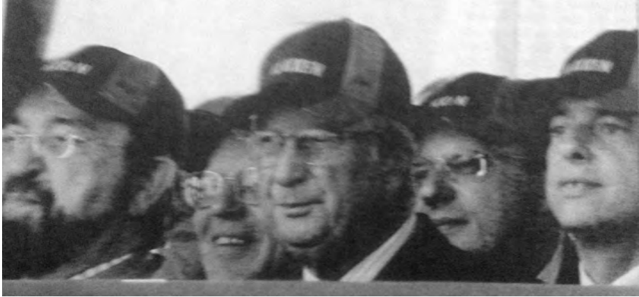
Afb. 5. Tot en met Albert II en de ministers met politiepetjes op de Flikkendag (ongedateerd knipsel).