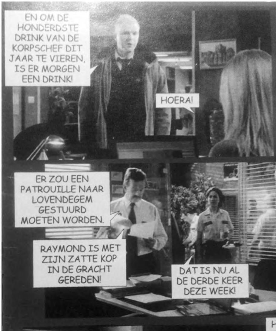
Afb. 6. Het ‘Gat van de wereld’ in Humo 24 maart 2009 zag het toch iets anders, meer gelijkend op wat in enkele passages van de memoires van onzen ‘azent’ te lezen valt.

Koop-en-Kluute : nen azent die bijkanst giene nekke ‘n oa en kleine van postuur woas.