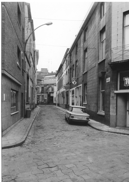
Afb. 1. Vanderdonckdoorgang gezien vanuit de Schepenvijverstraat in de jaren 1960-70. In de achtergrond de toegang tot de Brabantdam, een van de twee overdekte delen van die Y-vormige 'passage'. Met café Belgrado en 't Nieuw Kantientje.

De Belg is fier op 't feit dat hij wereldrecordhouder is voor verbruik van bier. We zagen dat Gent thans 1746 herbergen of drankgelegenheden en 655 opgegeven likeurwinkels telt. En de meeste uitbaters van deze zaken leven 'dik' op de opbrengst. Als men ziet het karig aantal personen die er zich heen begeven, stemt dit tot nadenken. Zeker het beroep van 'cafébaas' is niet steeds rooskleurig. Ze dienen te lachen zelf met de onnozelse praat van een dronkaard of halfdronken persoon, maar dit sluit niet uit dat ze daarmee hun kosten dekken en leven. Oneerlijkheid zal dan wel in sommige gevallen er de reden toe zijn.