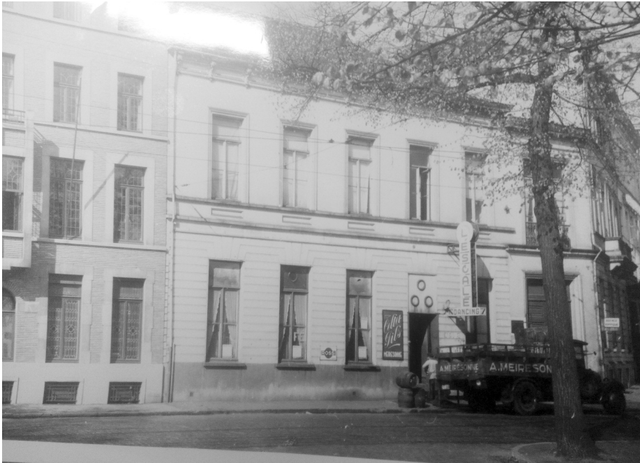
Afb. 4. Dancing l'Escale aan de Franklin Rooseveltlaan bij het Frankrijkplein. Met vrachtwagen van bierleverancier Meiresonne voor de deur. (foto vermoedelijk jaren 1950, coll. Vollaert).

grond in de Wondelgemstraat zo'n instelling heeft. Op geklop wordt de deur geopend, de lidkaart (5 Fr. per maand) vertoond en binnengelaten. De nachtbars zijn ook meestal dansinrichtingen. Hun privaat karakter laat er dit toe. Wat er de moreel aan wint is meer dan problematiek.