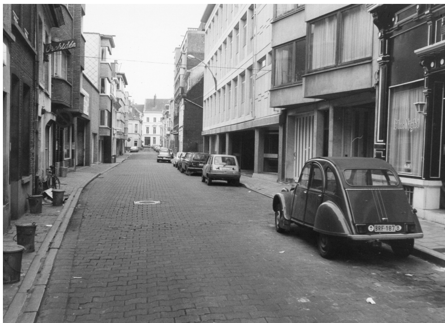
Afb. 2. Belgradostraat in de jaren 1960-70 gezien vanuit de Brabantdam met links het hoerenkotje Orchidée en rechts Bleu Night. In de achtergrond de Keizer Karelstraat. Anno 2017 is Bleu Night zijn naam verloren, maar heeft zijn functie behouden. De Orchidée moest plaats ruimen voor parking.

Wie zegt herberg spreekt ook van meer verdachte gelagzalen waar achter wazige of dikke gordijnen men liefst alleen komende heren ziet en waar de dame of de dienstster of de kashoudster alles in 't werk stelt om die heren al de gewenste en verwachte 'genoegens' te schenken tegen klinkende munt. Dit soort liefdewinkels en plezante cafétjes (afb. 1 en 2) zijn te Gent meer geconcentreerd in 't stadscentrum (Zuid) en rond de haven. De uitbaters en hun dienststers zijn op hun manier mensenkenners. Pornografische beelden of afbeeldingen, sterk opzweepende dranken of andere verdovingsmiddelen (cigaretten met marihuana bv.), provocerende kledij of houdingen, onzedige of woordspelende gesprekken, worden gebruikt om de geslachtsdrift van de bezoeker op te wekken of op te zwepen.