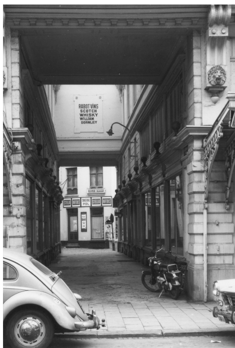
Afb. 3. Een zedige inblik vanuit de Vlaanderenstraat in het later gebouwde (tweede) overdekte deel van de Vanderdonckdoorgang. In de achtergrond Taverne Pol in de Schepenvijverstraat (foto jaren 1960-70, coll. Vollaert).

Verder dit artikel over de herbergen uitbreiden zou ons nog steeds maar meer bewijzen dat het niet buiten de huiskring is dat men plezier moet zoeken. Buiten hoofdpijn vindt men er ledige beurzen, en deze dienen dan weer maar eens gevuld, want 't plezier dient voort te bestaan en werk levert gewoonlijk niet genoeg op om dit te verwezentlijken. Men doet zijn familie te kort of men besteelt zijn evenmens. In 't eerste geval dwingt men de familieleden tot alle soorten van middelen om te leven {gewoonlijk onwettelijke}, in 't tweede begaat men zelf inbreuken.