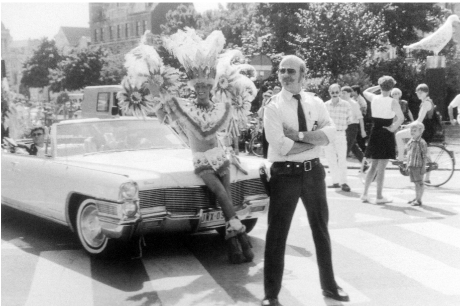
Afb. 2. Wie is de mooiste? (Gentse Feesten, 1997).