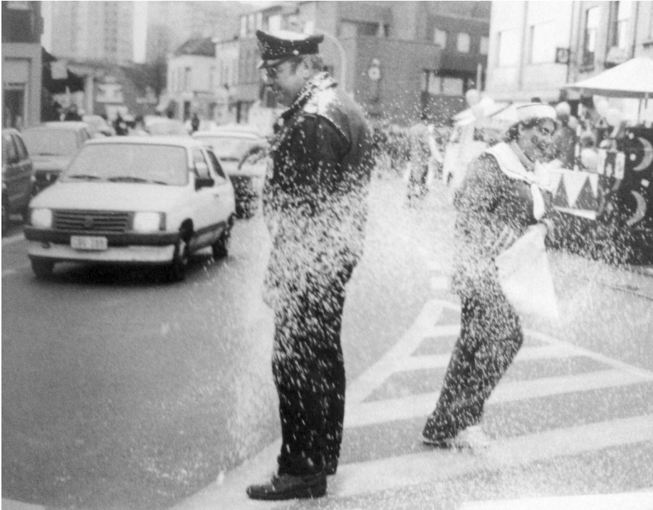
Afb. 3. Wat een azent lijden kan. Dit keer op carnaval Ledeborg