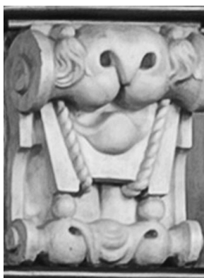
Afb. 4. Schouwmantelornament in Oostenrijkse zaal van het stadhuis.

Lezer Luc Bucquoye is sinds geruime tijd op zoek naar de eventuele betekenis van een detail op een schouwmantel in het Gentse Stadhuis (afb. 4). In het Oostenrijks salon vind je vijf fijn gesculpteerde consoles in de architraaf van de schouw. In het midden een saterkop met ernaast engelkopjes en uiterst rechts en links twee identieke exemplaren van de raadselachtige sculptuur getoond op de afbeelding. Het geheel zie je heel goed als je via internet een virtuele rondgang maakt in het stadhuis. Kan iemand hem helpen?