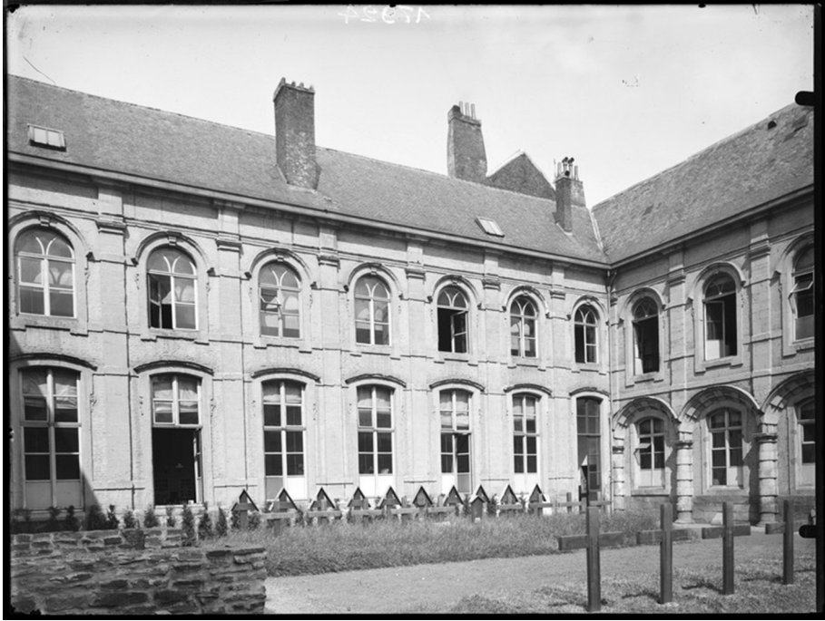
Afb. 5. Schoolspeelplaats in de Volderstraat tijdens WO I.

volgende adres aangegeven: Gräber-Verwaltung, Gent, Dockplatz 23. Gräberverwaltung. Ausgrabungen, Leichenüberführungen (bron: Etappen - Inspektion 4. 1 b. Nr. 3000. A.). De graven op de foto dateren vermoedelijk uit de eerste maanden van de oorlog en werden nadien overgebracht naar het Soldatenfriedhof op de Westerbegraafplaats. In de jaren 1956 werden alle gesneuvelde Duitse militairen uit de beide wereldoorlogen overgebracht naar Vladslo en Langemarck (WO I) en Lommel (WO II).