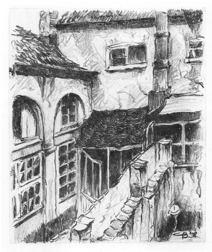
Afb. 1. Ex-dominicanenklooster in Onderbergen.