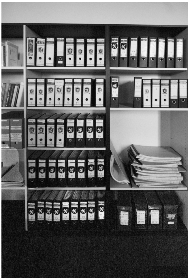
Afb. 3. Krantenknipselarchief van Hugo Collumbien in het Stadsarchief Zwarte Doos.

redactionele rekening nam. Hij baseerde zich daarvoor op zijn uitgebreid archief, waarvan o.a. de krantenknipsels zorgvuldig geklasseerd in ordners, aan het Gentse Stadsarchief werden geschonken. Ze staan opgesteld in de leeszaal van de 'Zwarte Doos' en zijn er iedere week gemakkelijk raadpleegbaar van maandag tot en met donderdag in de voormiddag (zie afb. 3). Daarin is echter niets te vinden over de school.