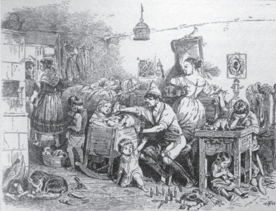
Afb. 2. 'Schoenmakersfamilie' Theodor Hosemann (1807 – 1875). Uit: Schidrowitz, L., Sittengeschichte des Proletariats, Wenen - Leipzig, zonder jaartal.