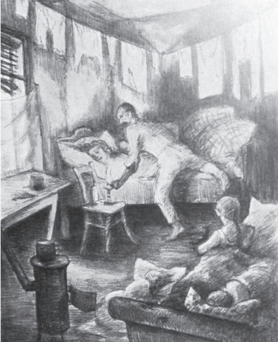
Afb. 1. Litho van Viktor Leyer met als titel (vertaald): 'Plaats is er in het kleinste hutje' (uit: Schidrowitz, L, Sittengeschichte des Proletariats,, Wenen - Leipzig, zonder jaartal).

dag. De slaapgelegenheid in die hollen beperkt zich tot een of twee kamers waar alles maar dooreen slaapt.