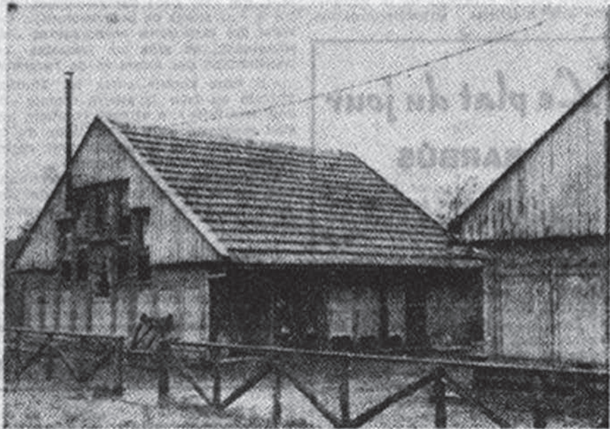
Les pavillons de l'ancienne école gardienne de la rue du Patijntje qui seront remplacés par des bâtiments modernes.

Le Collège des bourgmestre et échevins approuva au cours de sa réunion du 20 avril dernier, le projet en question pour la fourniture du pavillon. I